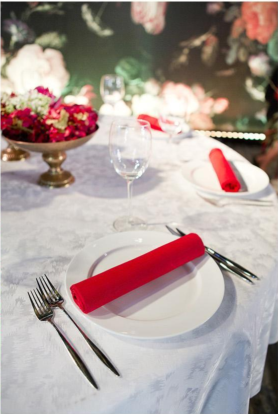
Банкетные накрытия и