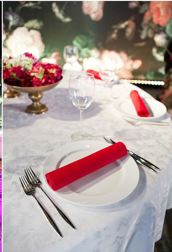
Банкетные накрытия и