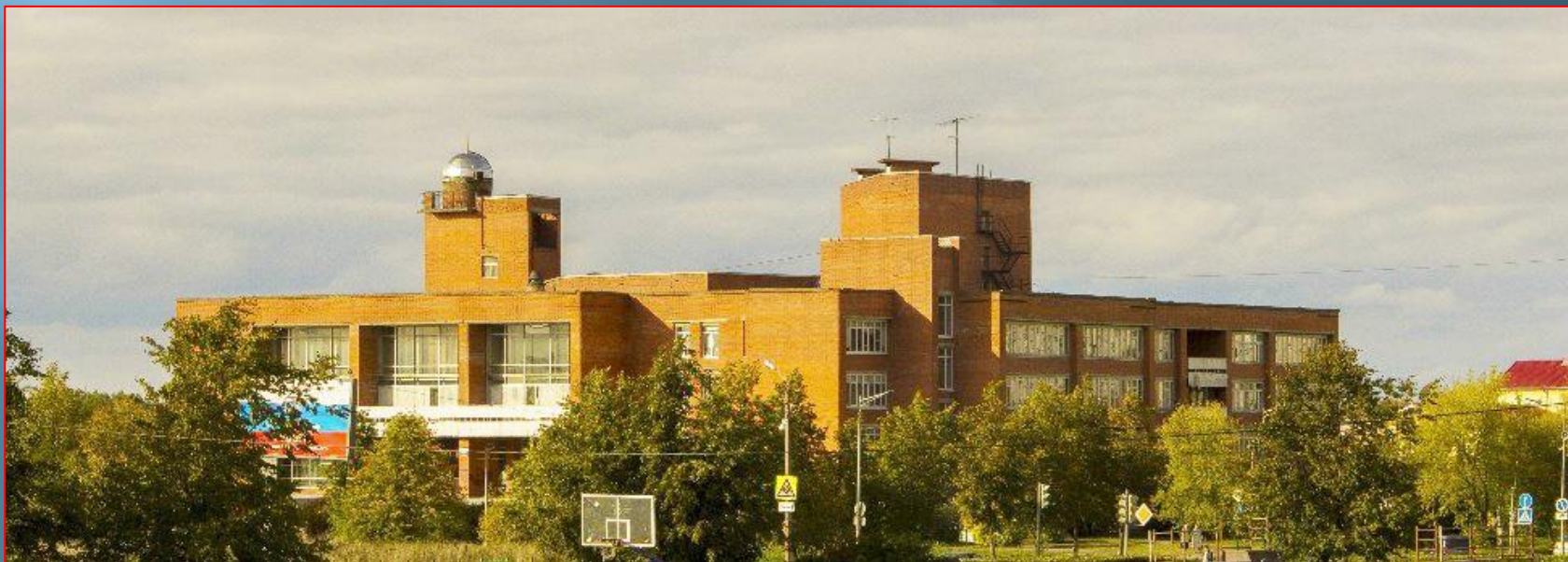
Киришский дворец творчества имени Л.Н. Маклаковой