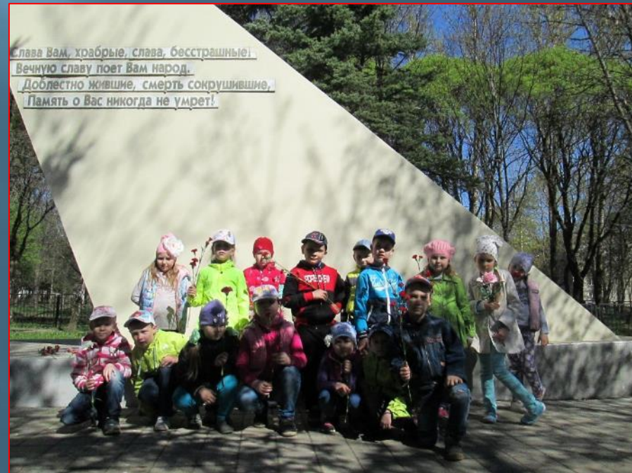
Стела «Передний край обороны»