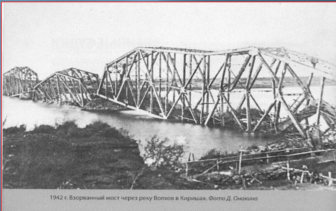
1942 г. Взорванный мост через реку Волхов в Киришах.

Там, где сейчас стоит город, в течение двух лет не смолкал грохот канонады и не рассеивался дым от взрывов бомб и снарядов.