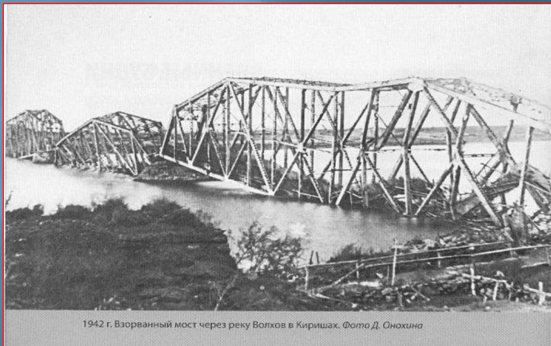
1942 г. Взорванный мост через реку Волхов в Киришах.

Там, где сейчас стоит город, в течение двух лет не смолкал грохот канонады и не рассеивался дым от взрывов бомб и снарядов.