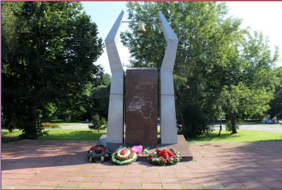
Памятник «Погибшим деревням»