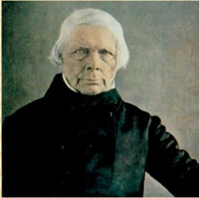
ФРИДРИХ ШЕЛЛИНГ (1775-1854).