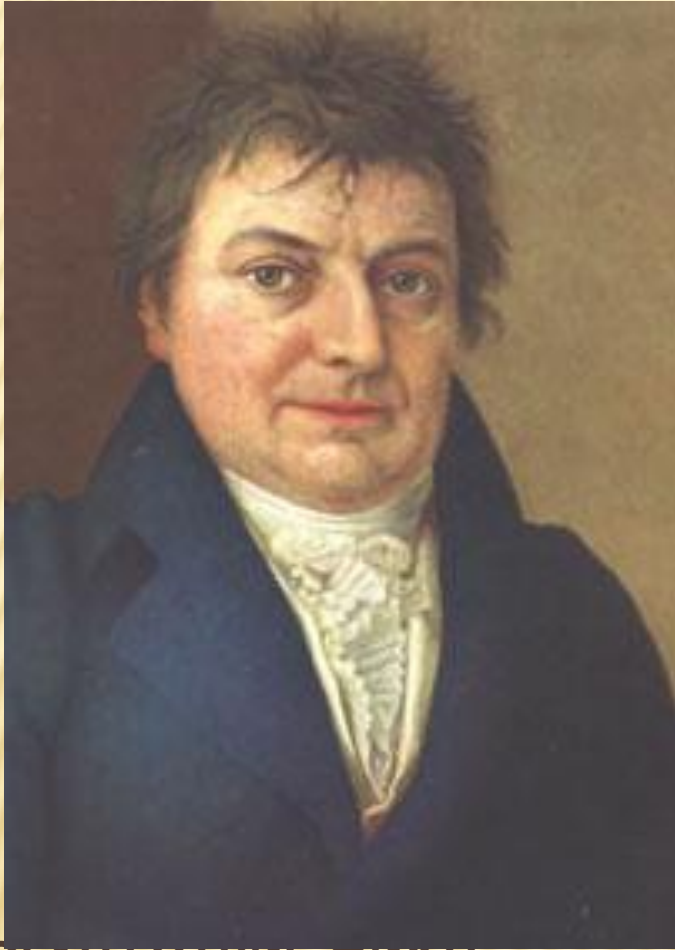
ИОГАНН ГОТЛИБ ФИХТЕ (1762-1814).