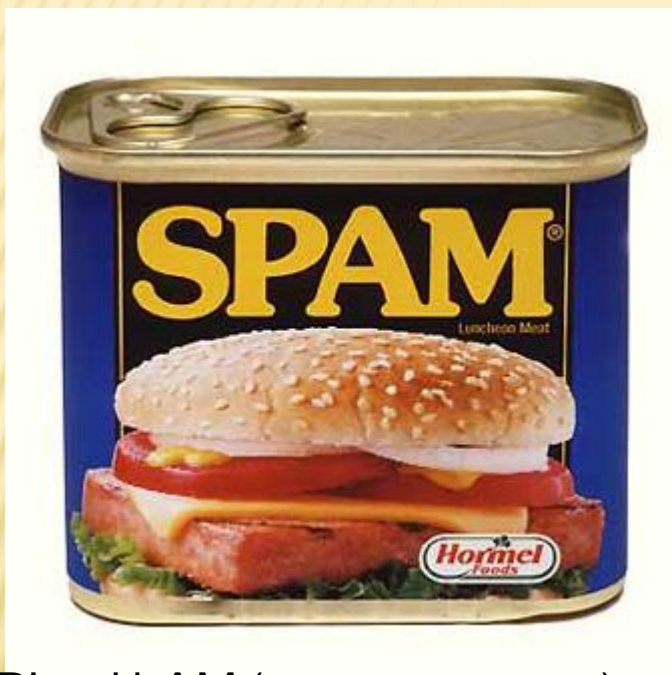
SPiced hAM (острая ветчина)

Спам (англ. spam) — массовая рассылка коммерческой, политической и иной рекламы или иного вида сообщений (информации) лицам, не выразившим желания их получать.