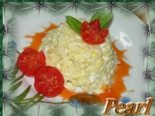
Рис едят отварным, из него варят каши и делают запеканки, рис добавляют в супы, салаты, используют как начинку для пирогов, готовят из риса плов с овощами и бараниной.