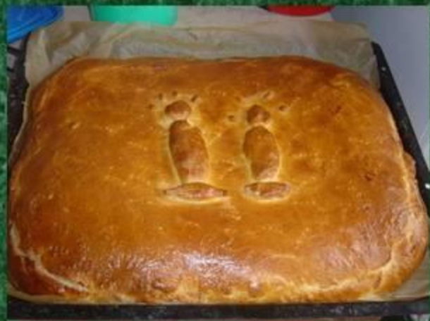
Рис едят отварным, из него варят каши и делают запеканки, рис добавляют в супы, салаты, используют как начинку для пирогов, готовят из риса плов с овощами и бараниной.