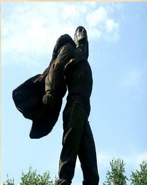
Памятник «Героям стратонавтам» открыт в 1963 году.