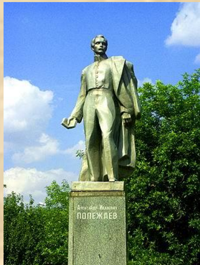
Памятник А.И. Полежаеву открыт в 1967 году.