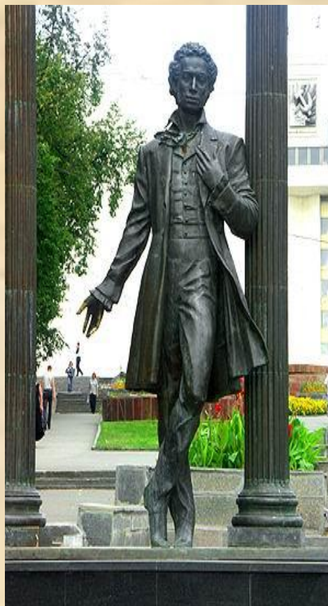
Памятник А.С. Пушкину открыт в 1977 году.