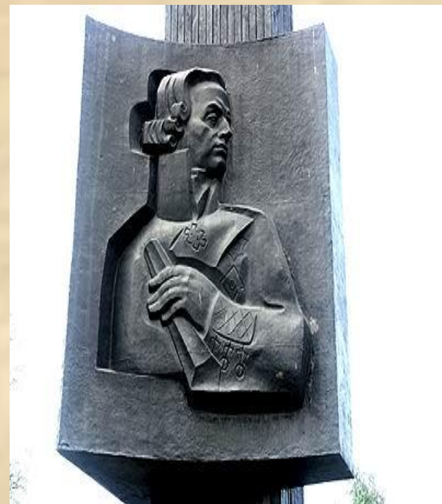
Памятник Ф.Ф. Ушакову открыт 10 августа 2006 года.