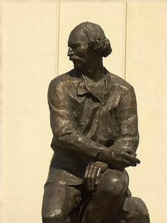
Памятник С.Д. Эрьзе открыт 4 ноября 1996 года.