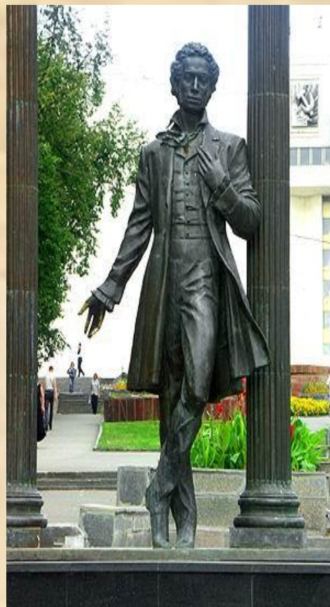
Памятник А.С. Пушкину открыт в 1977 году.