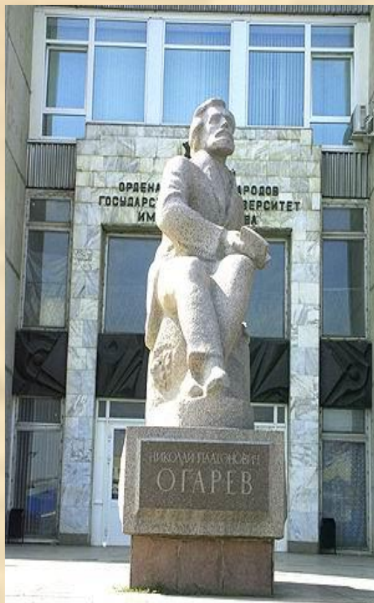
Памятник Н.П. Огарёву открыт 6 декабря 1984 года.