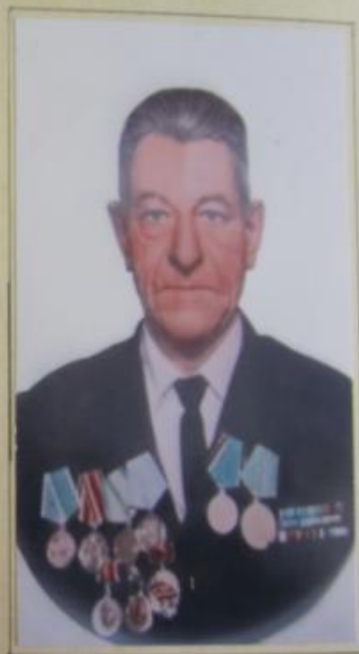
Трагедия и героизм

Мы должны помнить о тех, кто воевал за нашу свободу и независимость.