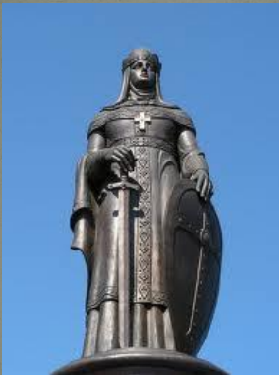
Пам'ятник у Києві