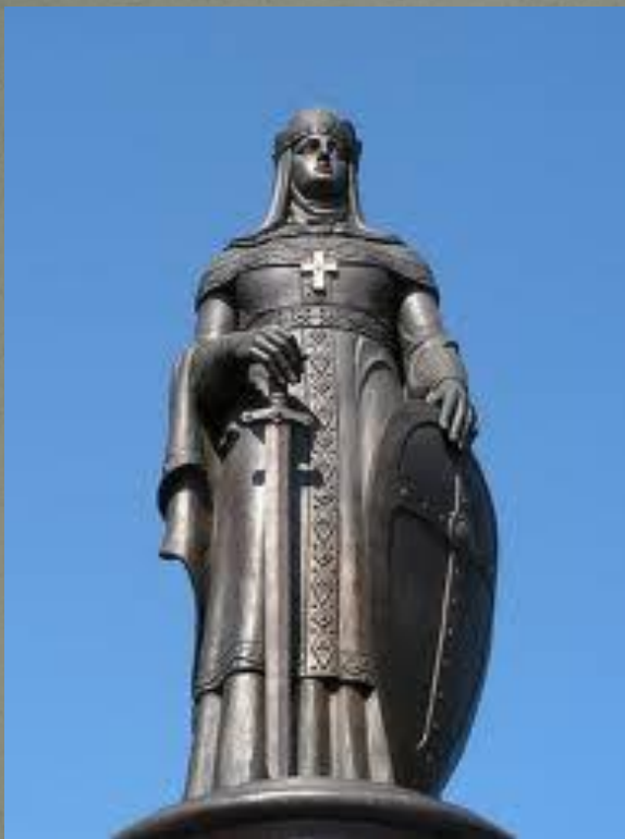
Пам'ятник у Пскові