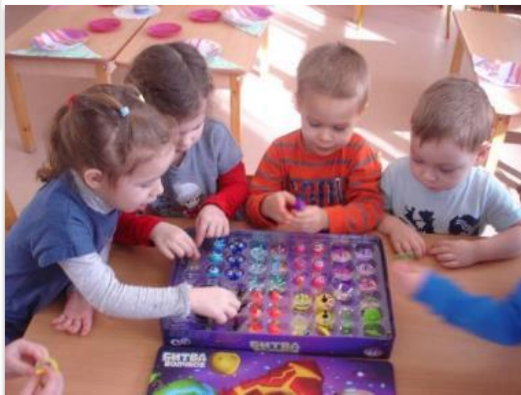
Коллекция детских «драгоценностей»