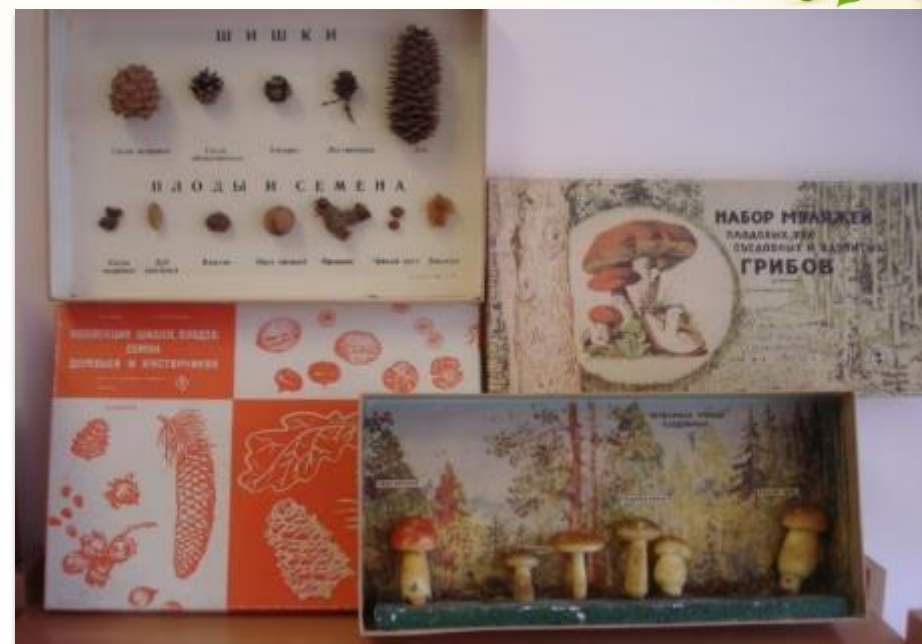
Коллекция шишек и семян деревьев и кустарников.