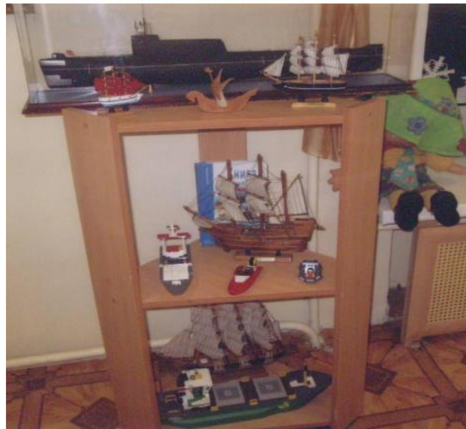
Коллекция морских судов