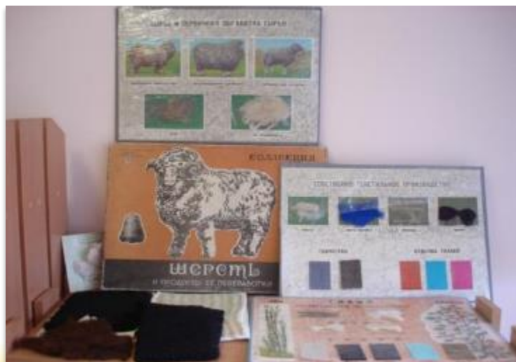
Коллекция «Шерсть и продукты её переработки»