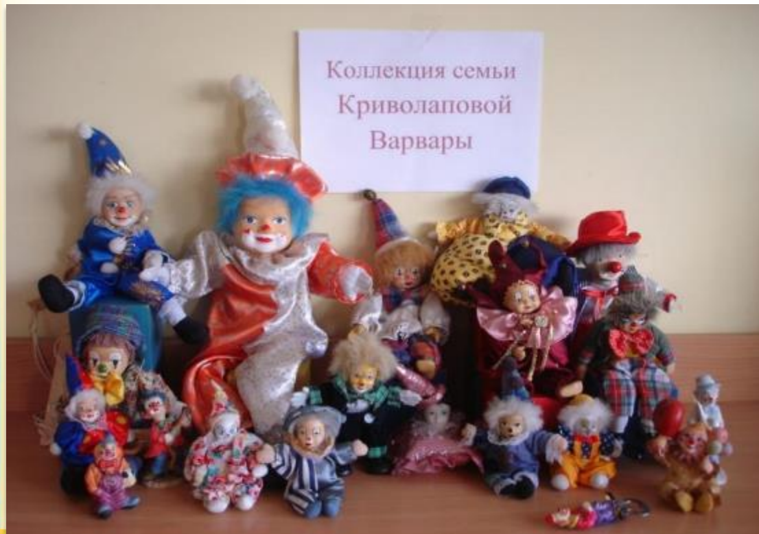
Коллекция веселых клоунов