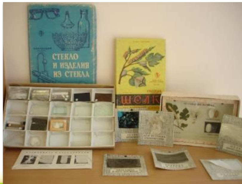
Коллекция стекло и изделий из стекла