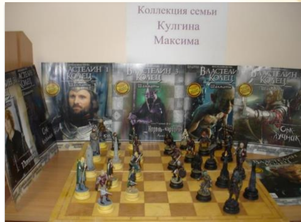
Коллекция «Шахматы «Властелин колец»