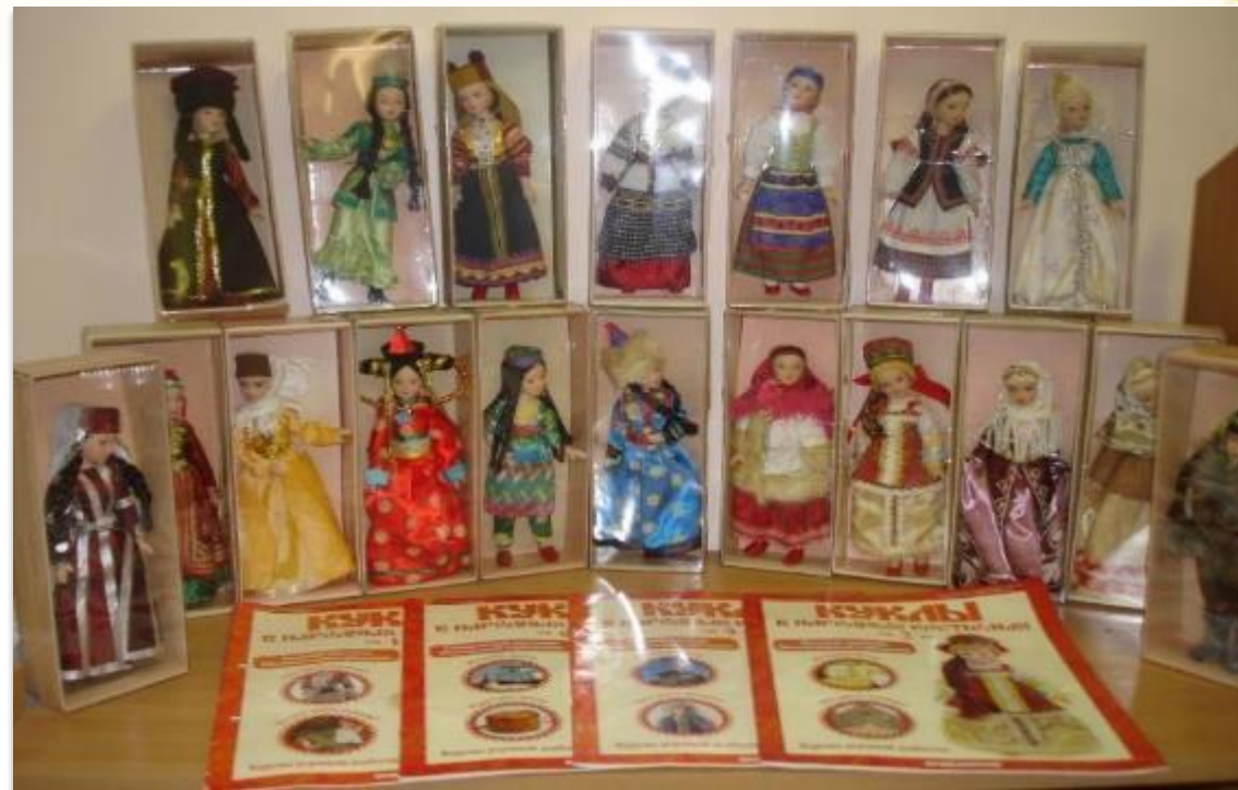
Коллекция кукол в национальных костюмах