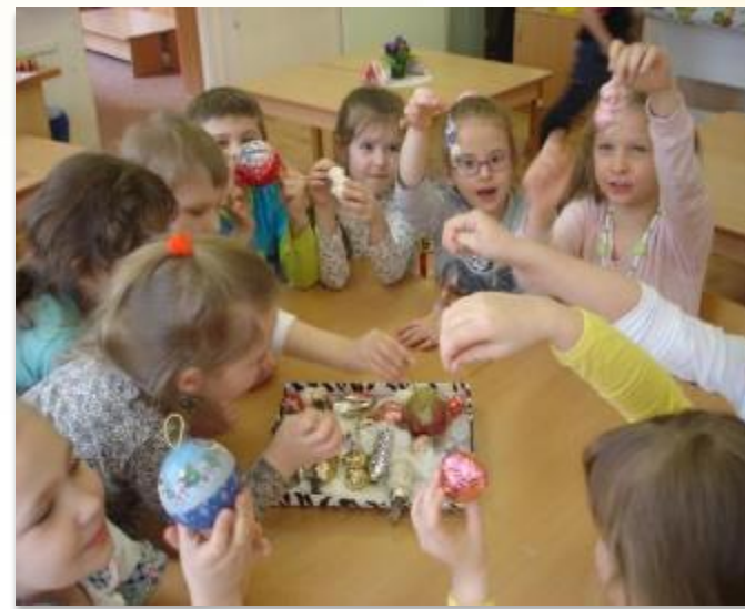
Коллекция елочных игрушек