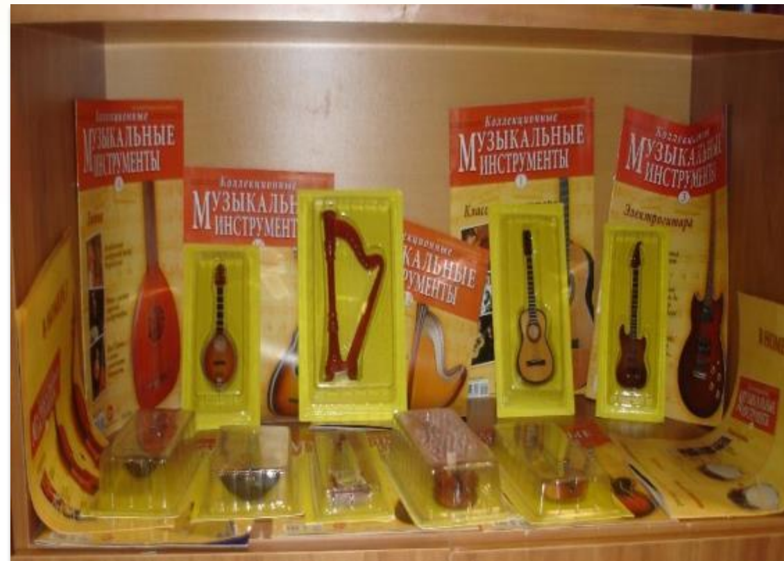
Коллекция музыкальных инструментов