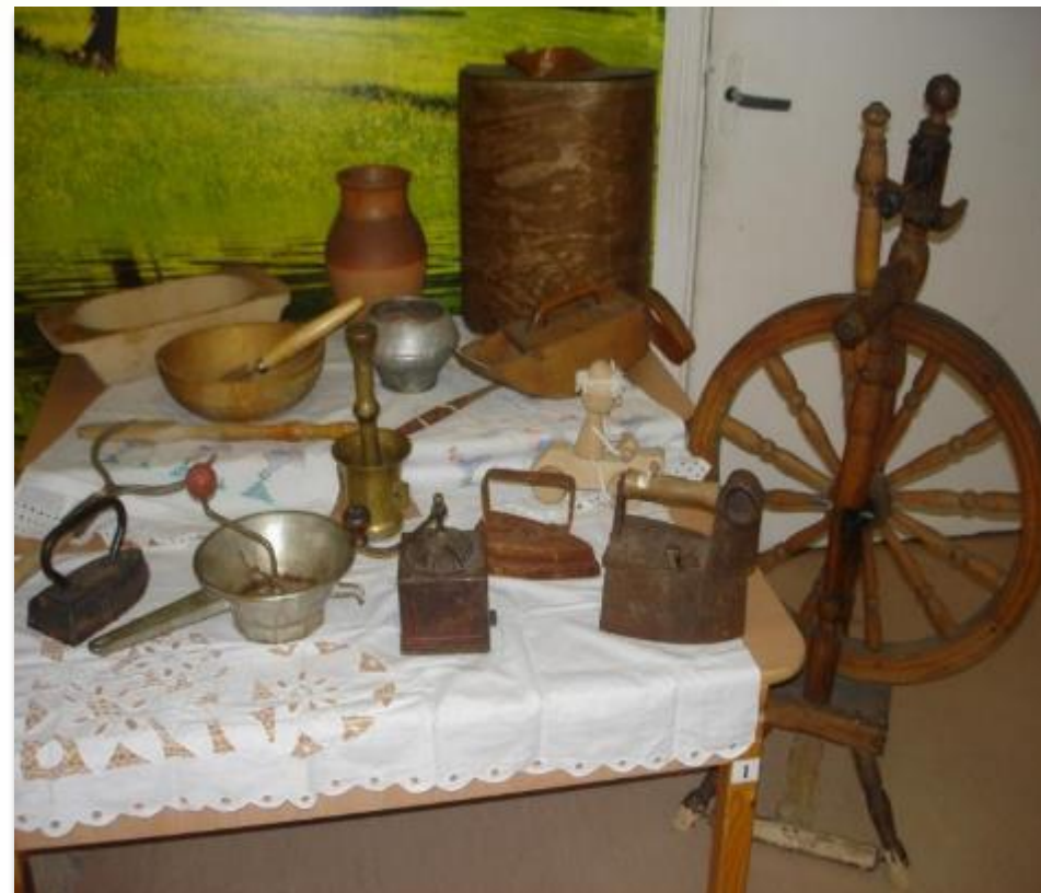
Мини-музей «Старинного быта»