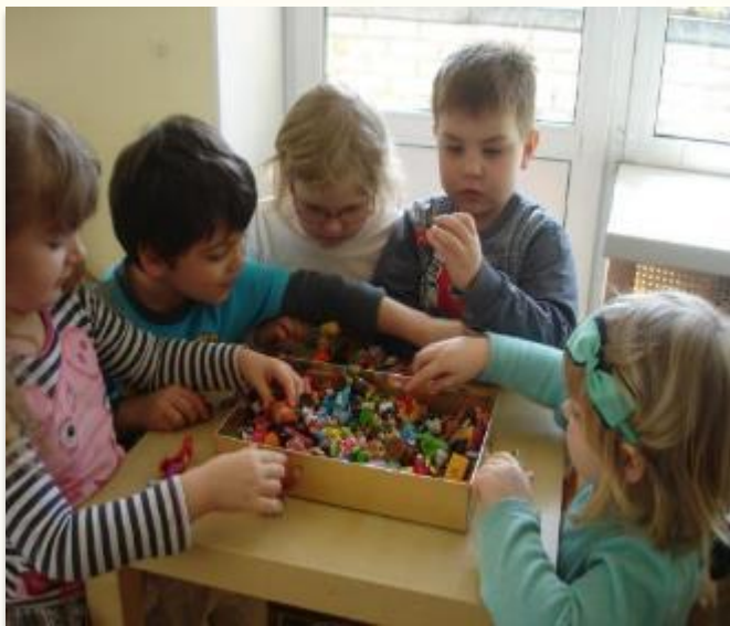
Коллекция пэт шоп