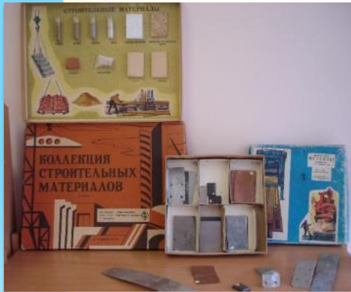
Коллекция строительных материалов