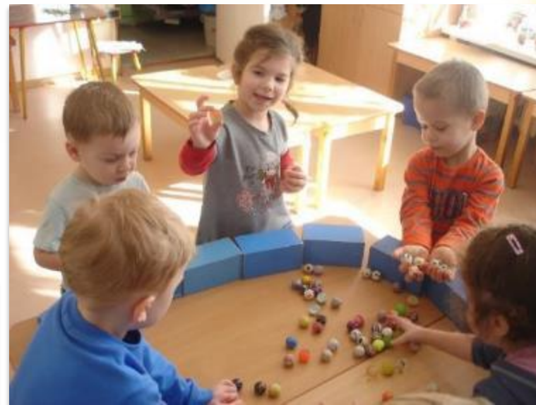
Коллекция мячей- попрыгунчиков В