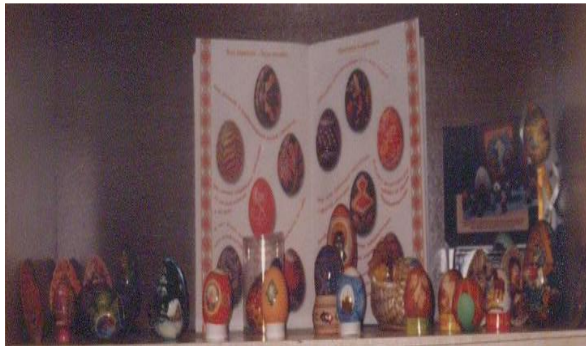
Коллекция пасхальных яиц