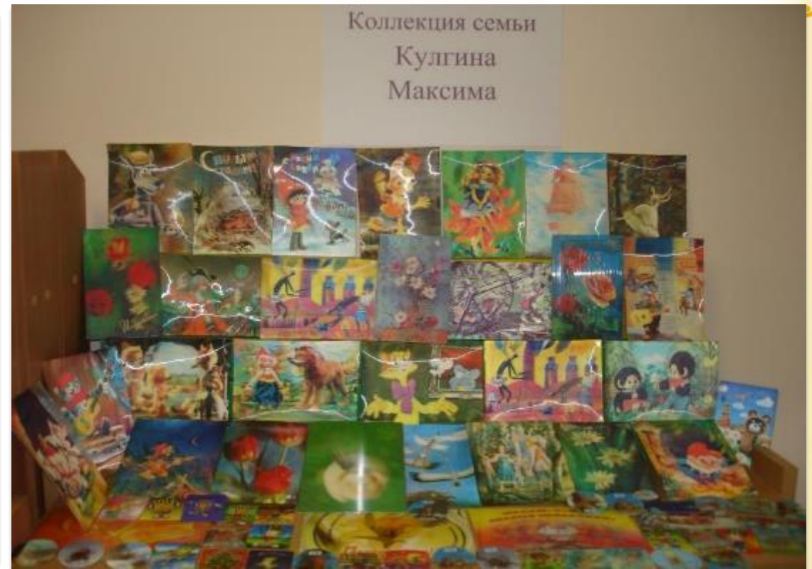
Коллекция «3D открытки»