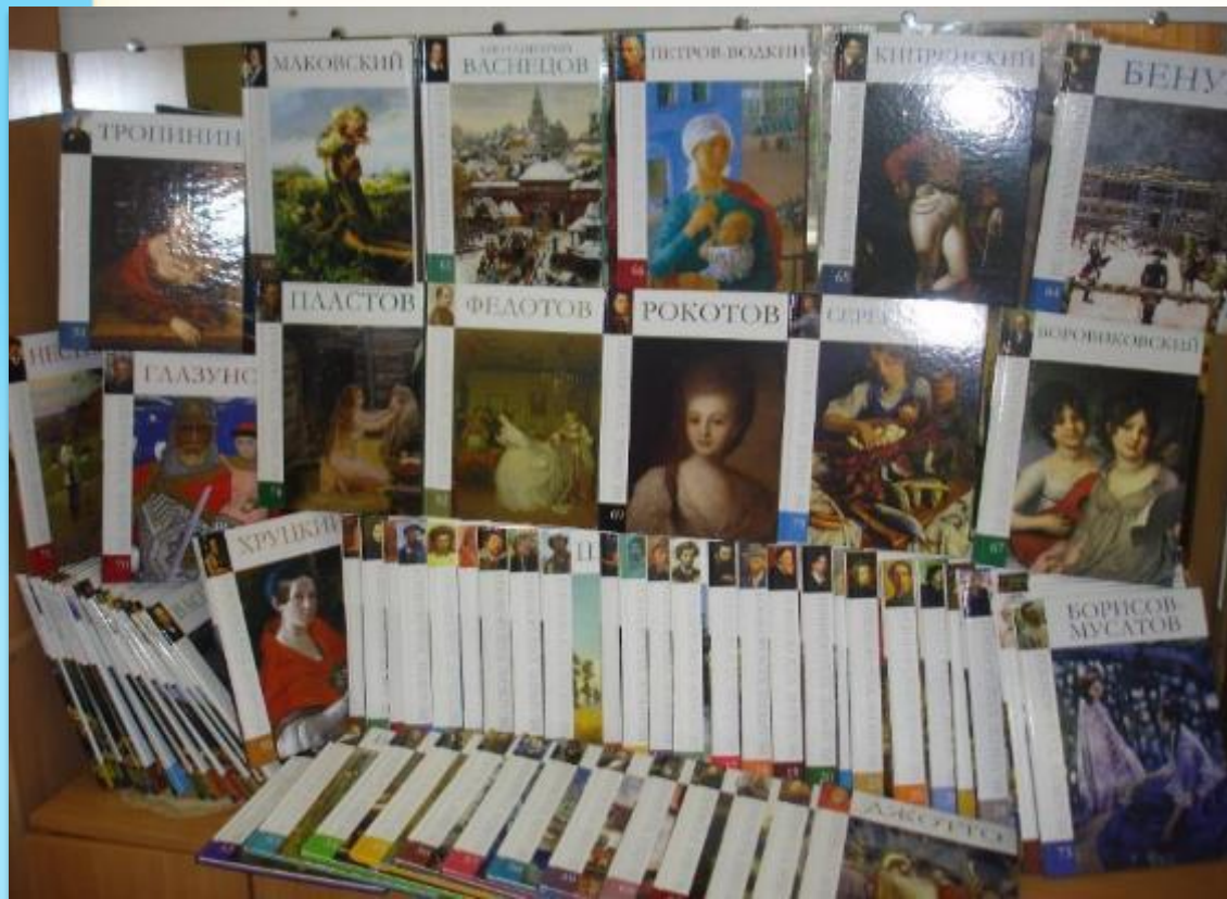
Коллекция книг о художниках