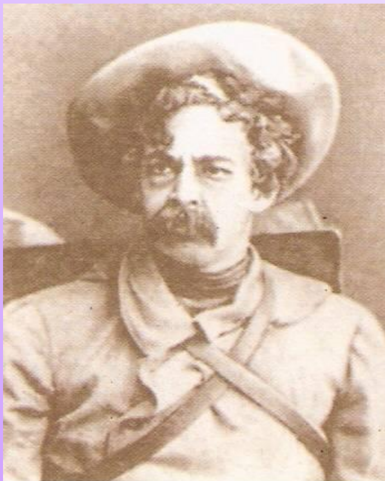
Несчастливцев — К.С. Станиславский

Создатель русского национального театра, Островский очень любил актеров, высоко ценил их душевное благородство и возвышенный образ мыслей.