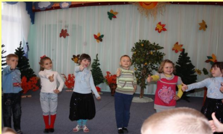
«Как живешь?»- «Вот так!»

Это танцы с несложными движениями, включающие элементы невербального общения, смену партнеров,