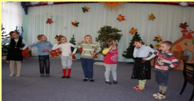
«Ухо правое вперед!»