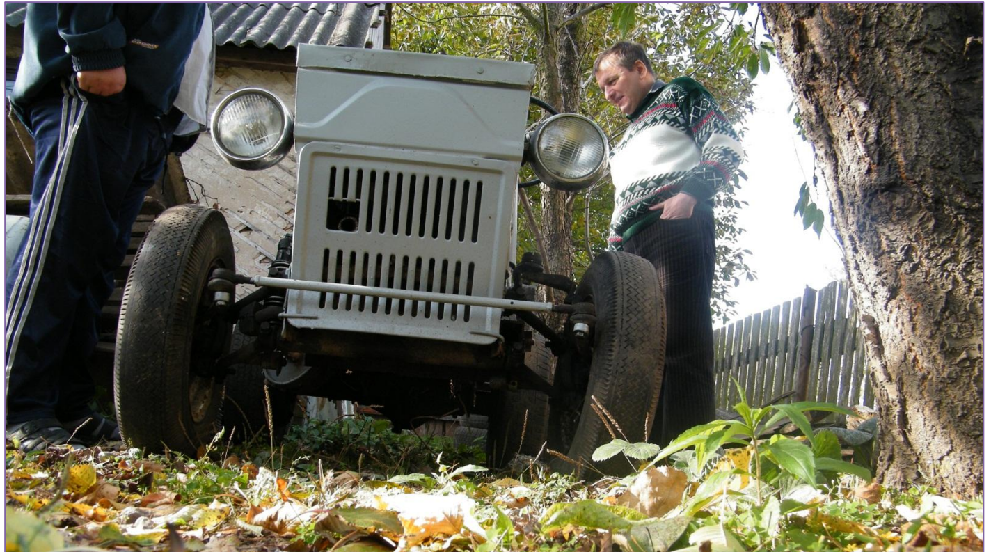
Міні-трактор із одноциліндровим ДВЗ «Зид».