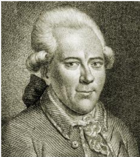
Георг К. Лихтенберг