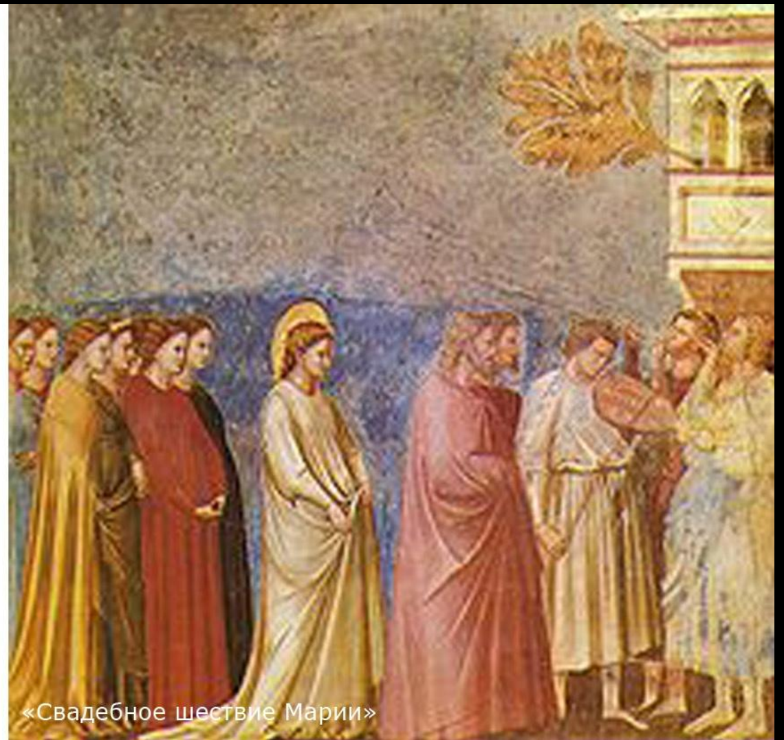
«Свадебное шествие Марии»