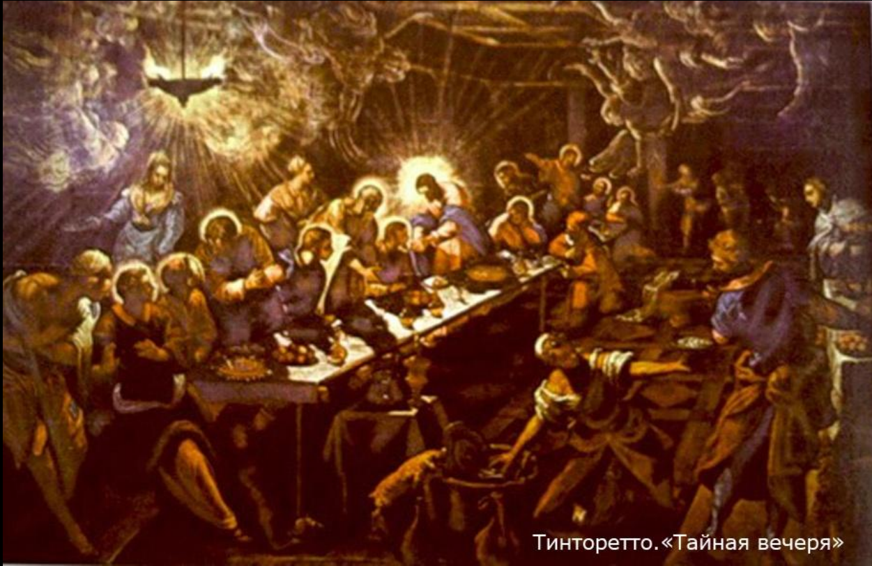
Тинторетто. «Тайная вечеря»