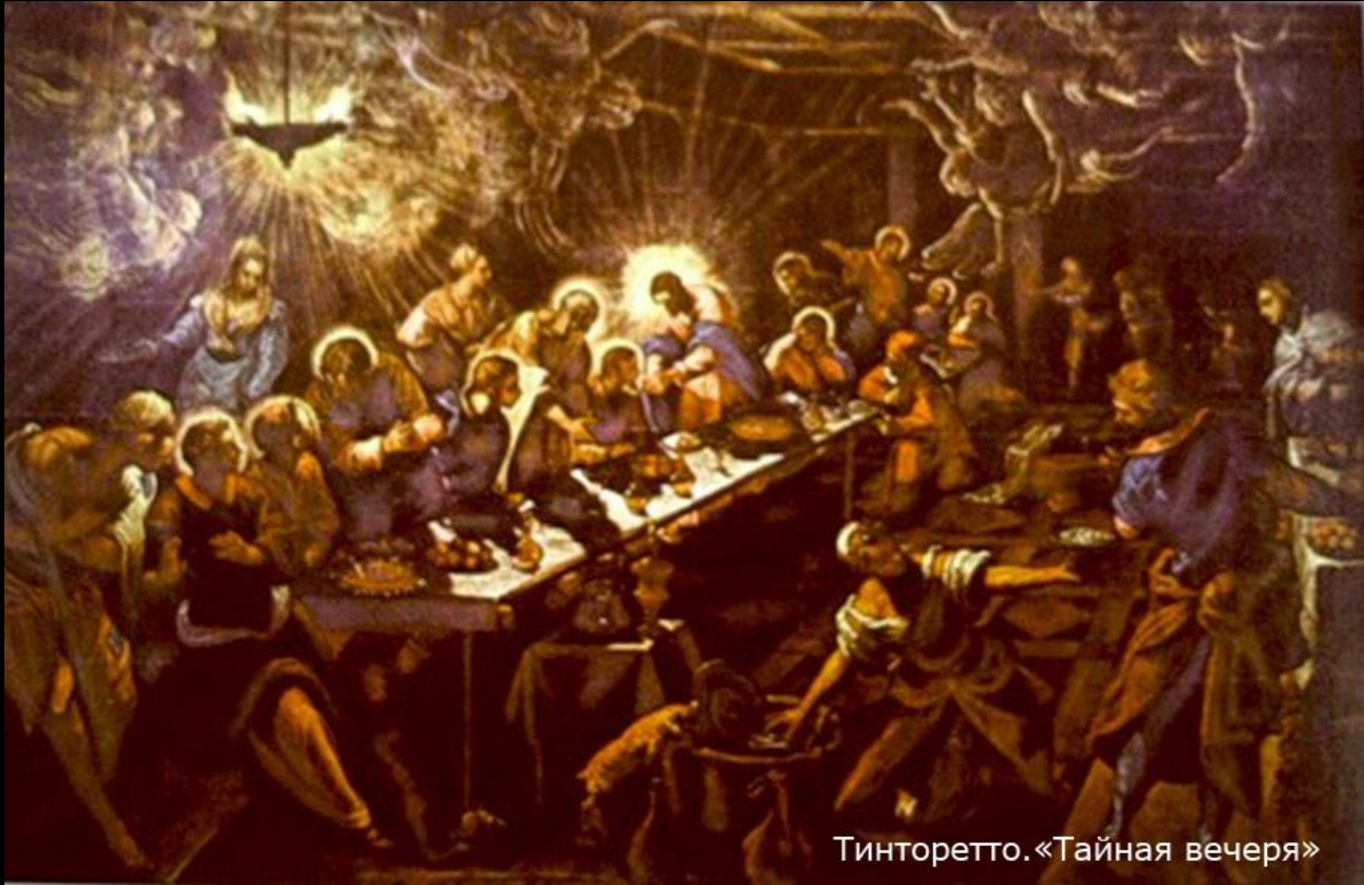
Тинторетто. «Тайная вечеря»