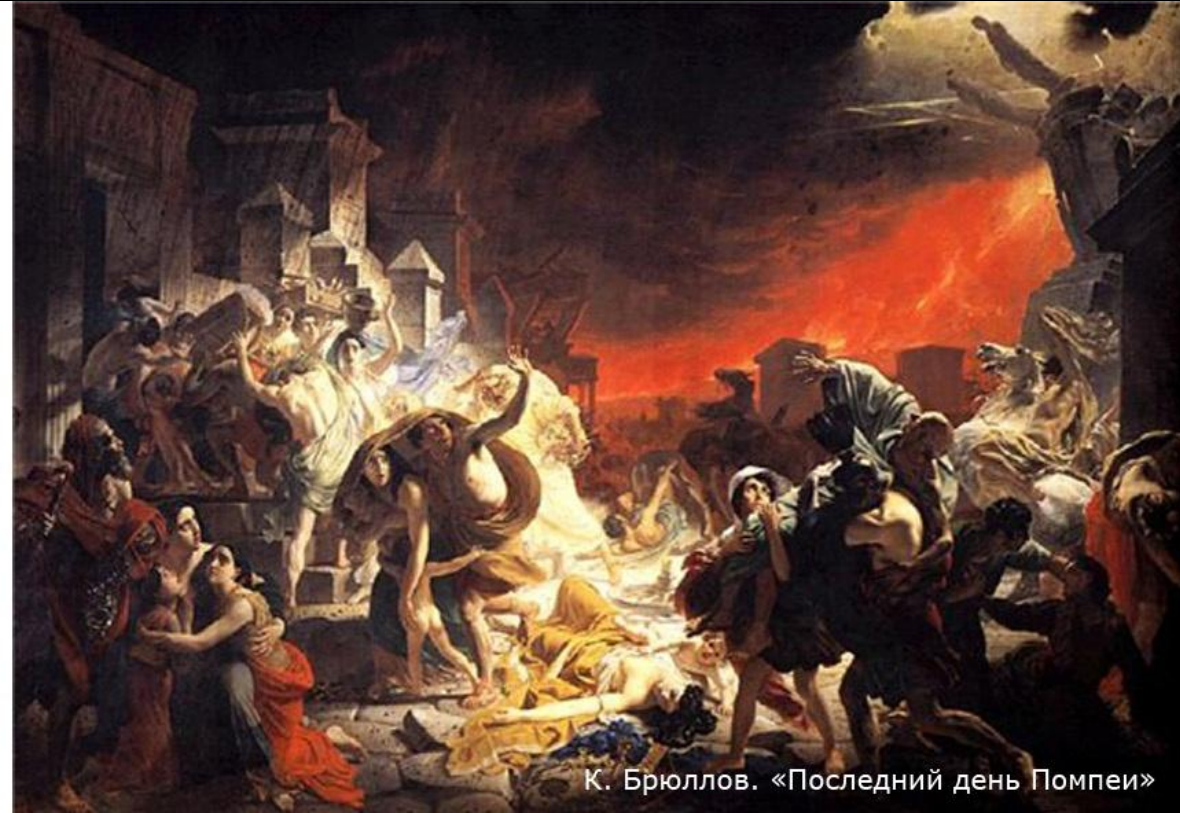
К. Брюллов. «Последний день Помпеи»