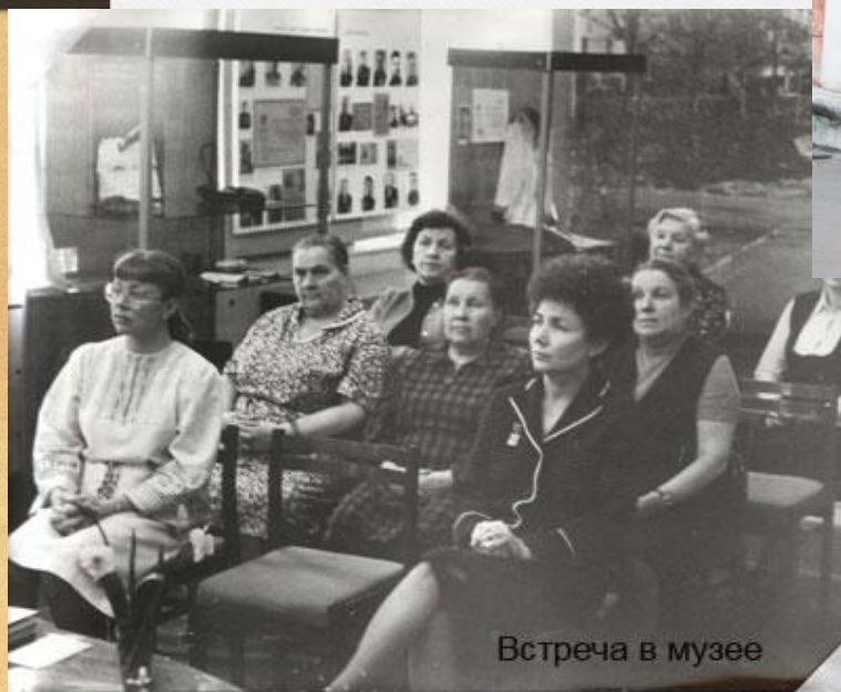
Встреча в музее