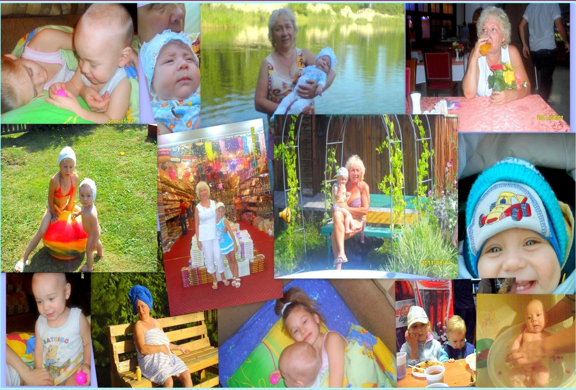
Бабушка, спасибо за все драгоценные моменты общения с тобой. Ты - наше счастливое детство!