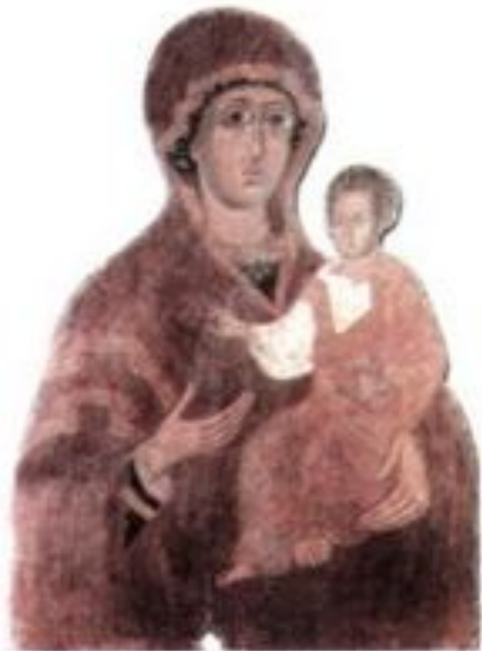
Ікона Богородиці з Успенської церкви в Дорогобужі. Кінець 13 ст.