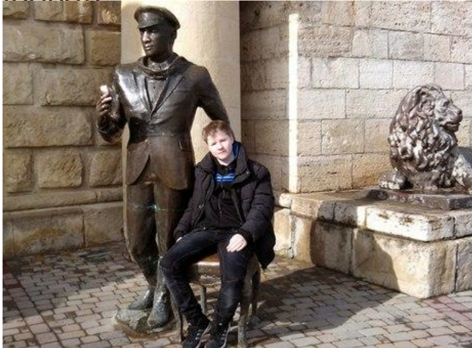
Скульптура Остапа Бендера г. Пятигорск

Провал считают визитной карточкой Пятигорска, а скульптура Орла считается визитной карточкой Кавказских минеральных вод.