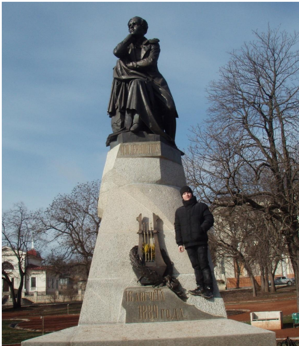
На фото памятник М.Ю. Лермонтову в г. Пятигорск

На Пятигорском кладбище могила Лермонтова появилась 17 июля 1841 года и тело пролежало 250 дней. Его бабушка, Елизавета Арсеньева, добилась разрешения перезахоронить внука на родине, в Пензенской области. Прах Лермонтова перевезли в Тарханы 23 апреля 1842 года на семейное кладбище, рядом с могилами деда и матери.