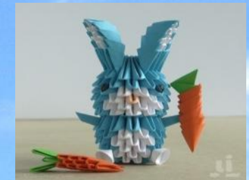
ИГРУШКИ ИЗ БУМАГИ