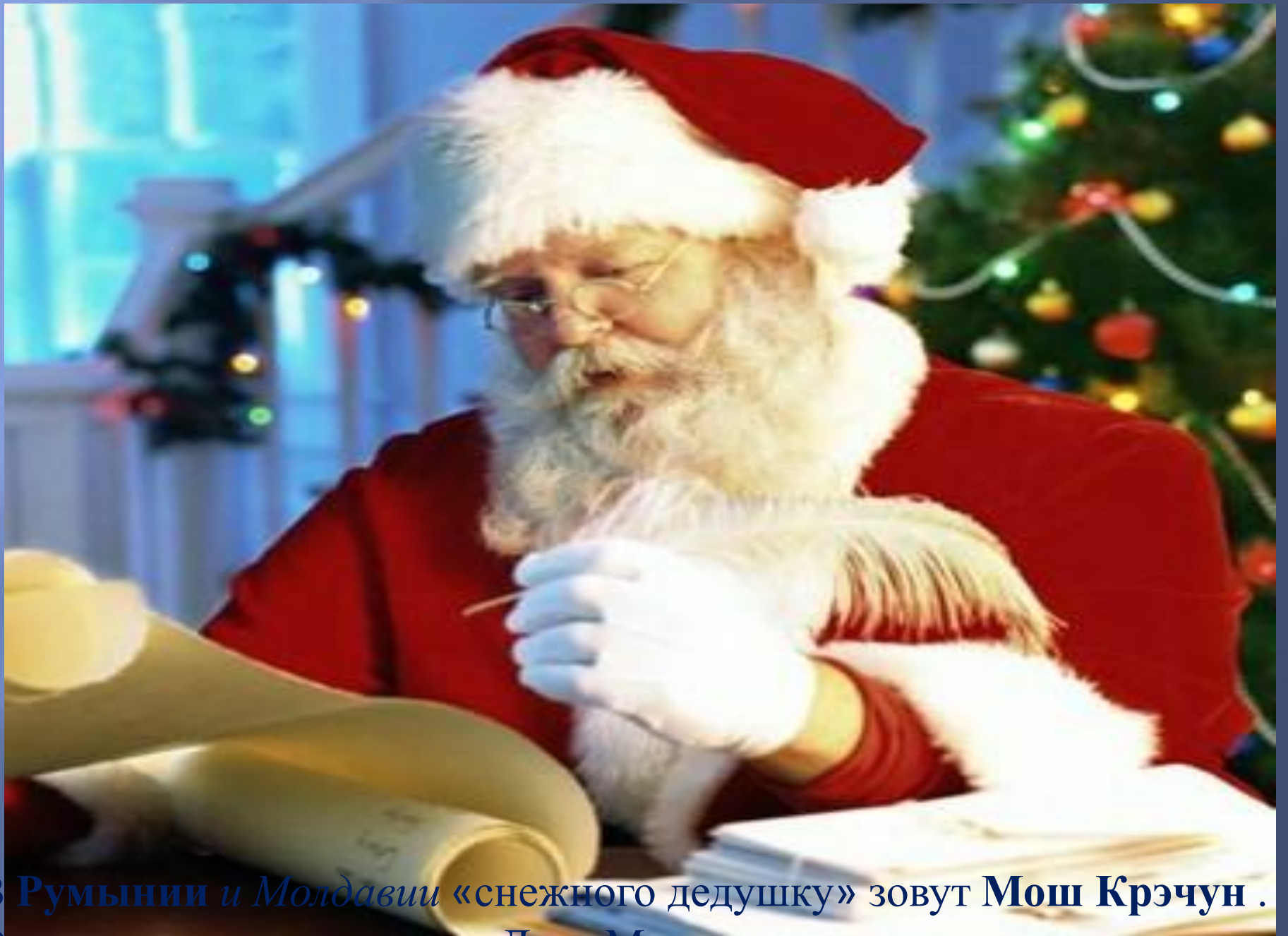
В Румынии и Молдавии «снежного дедушку» зовут Мош Крэчун . Он очень похож на нашего Деда Мороза.