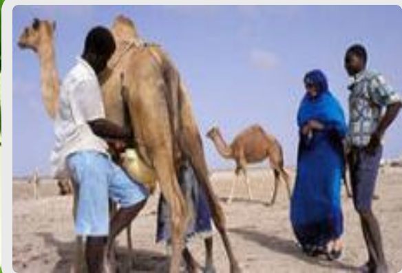
ШУБАТ ИЗ ВЕРБЛЮЖЬЕГО МОЛОКА