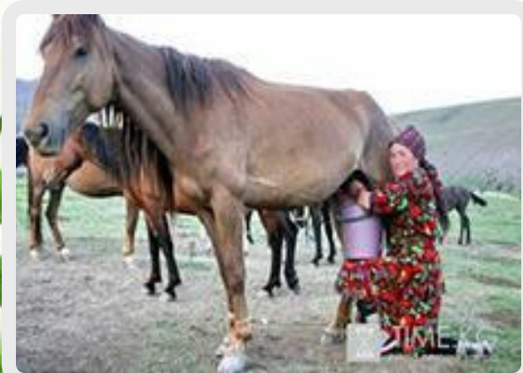
КУМЫС ИЗ МОЛОКА КОБЫЛИЦЫ