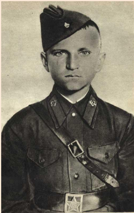
ПЕТЯ КЛЫПА (1926-1983)