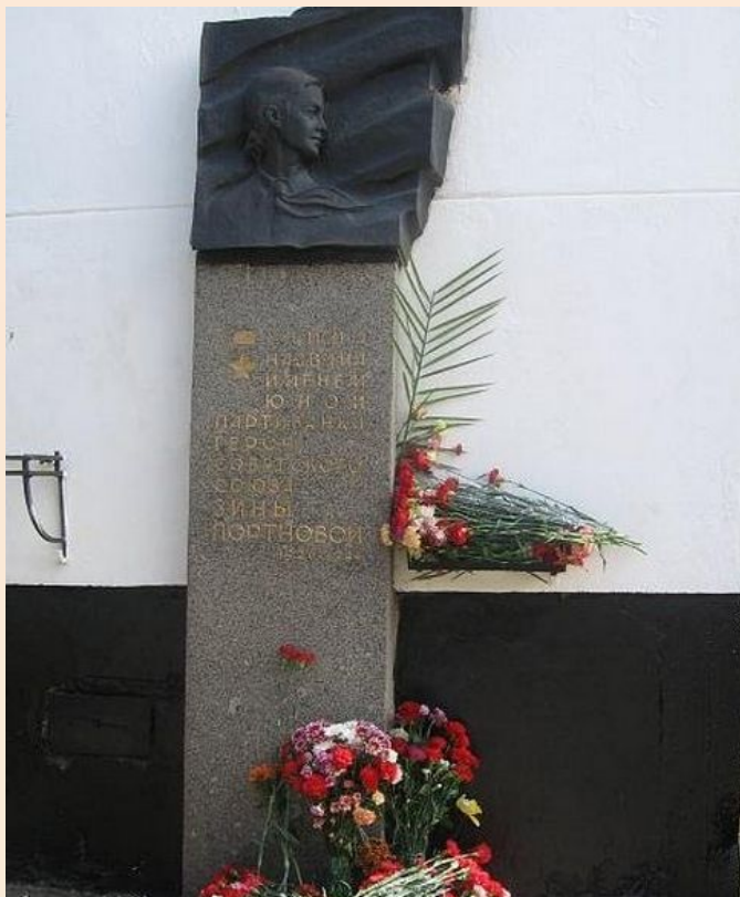
МЕМОРИАЛ ЗИНЫ ПОРТНОВОЙ В САНКТ-ПЕТЕРБУРГЕ.

И молниеносным движением вдруг Она пистолет выбивает из рук! И вот офицер убит на повал, А Зина бежит через темный подвал.