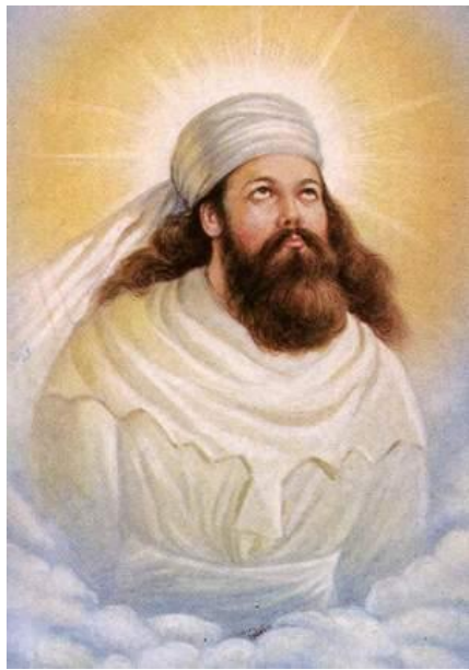
Заратуштра, 6-5 до н.