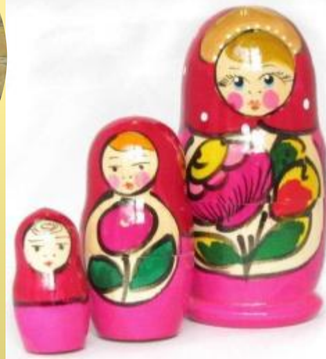
Матрешка Полхов - Майданская