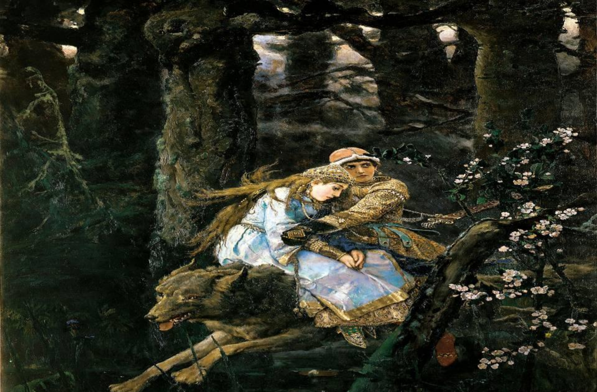
«Иван-Царевич на Сером Волке»