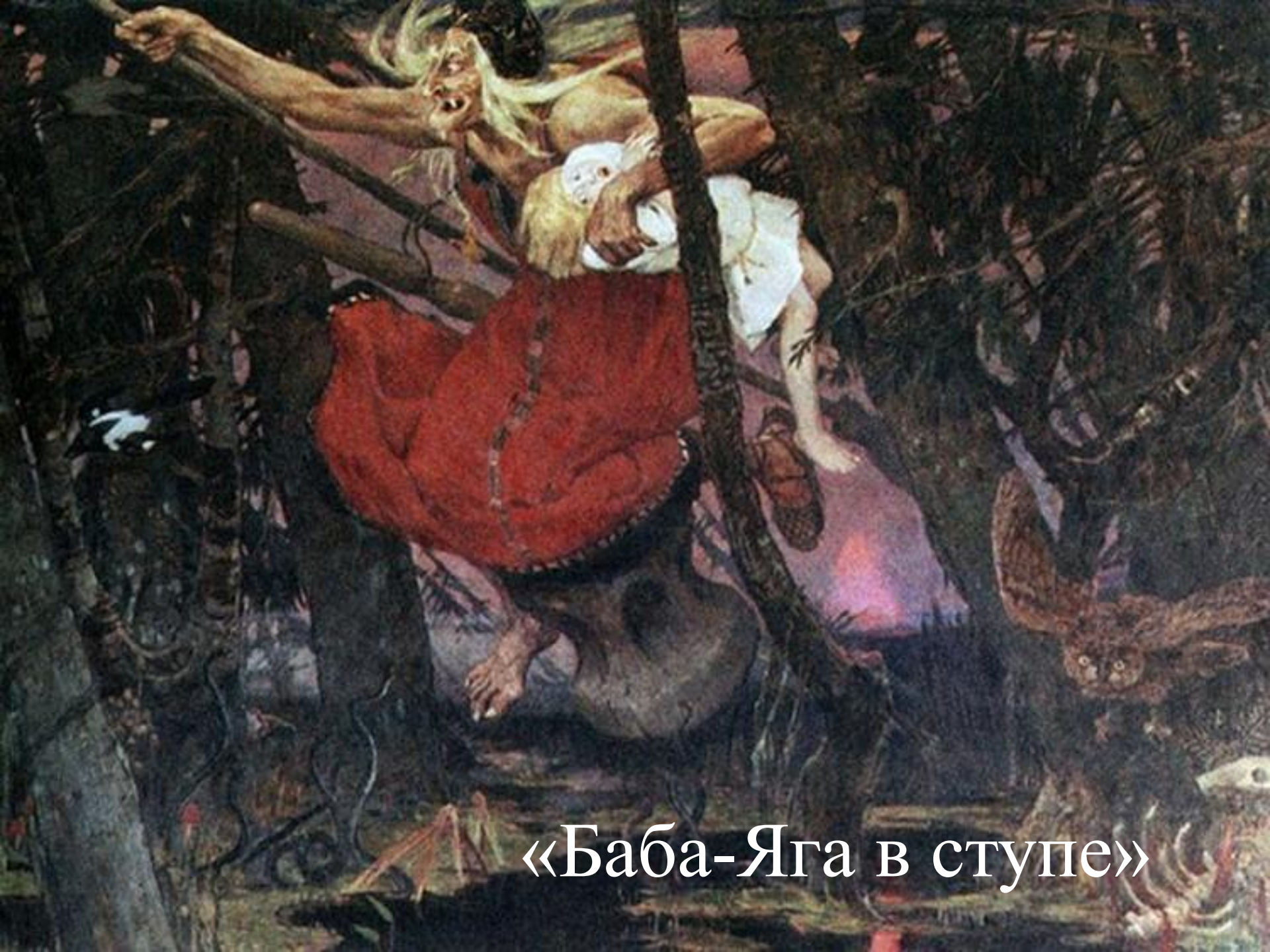
«Баба-Яга в ступе»