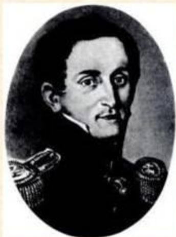
Отец К. Д. Ушинского