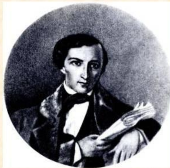
К. Д. УШИНСКИЙ