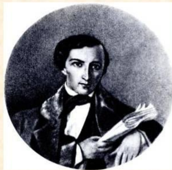
К. Д. УШИНСКИЙ