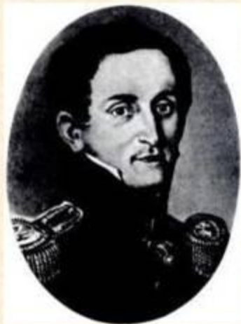
Отец К. Д. Ушинского