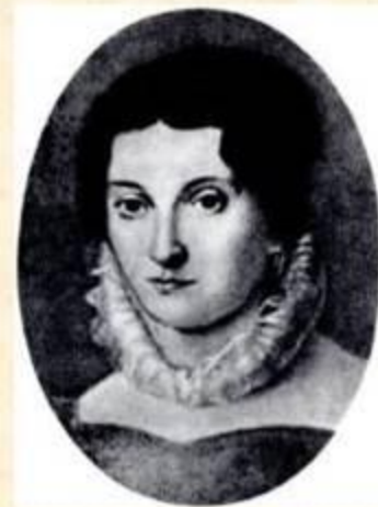
Мать К. Д. Ушинского