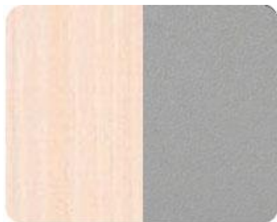
Береза полярная/ пепел