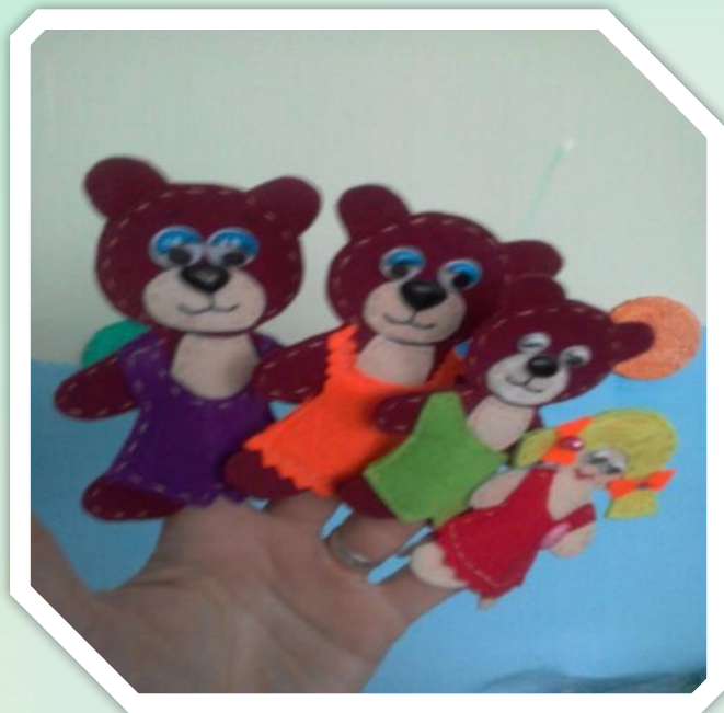
Пальчиковый театр «Три медведя»