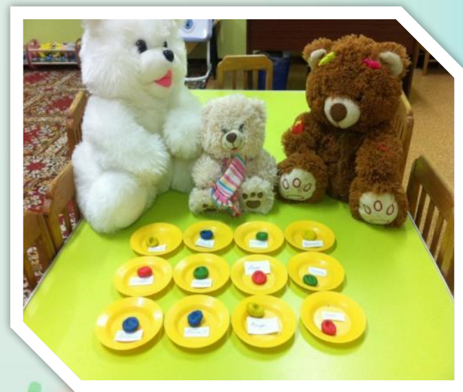
Лепка мисочек для медведей