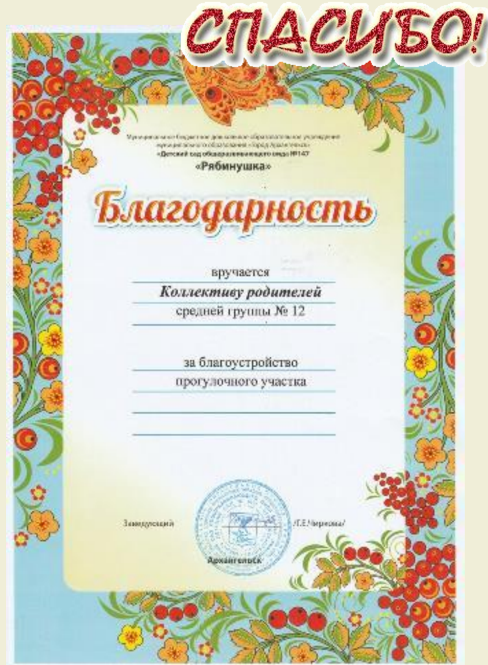
Ведение стенда «От чистого сердца примите слова благодарности...»