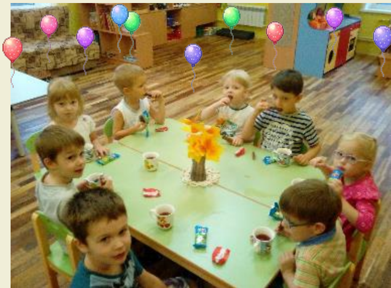
Празднование Дня рождения ребенка