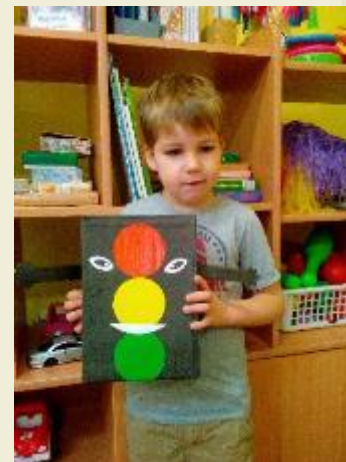
Совместное участие детей и родителей в конкурсах