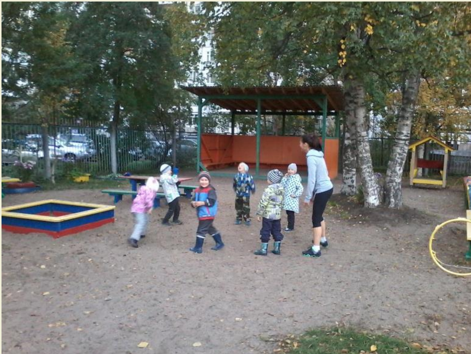
Участие родителей в подвижных играх с детьми во время прогулки