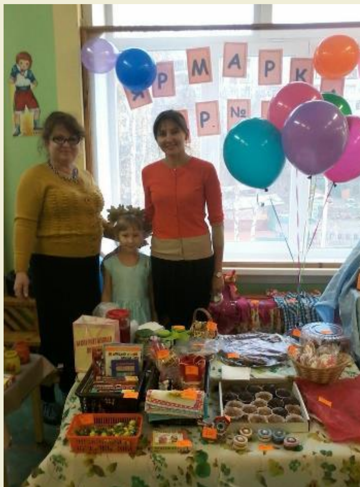
Участие членов семьи в Покровской ярмарке