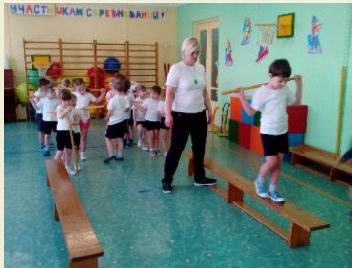
Фотографирование педагогами детей во время их пребывания в детском саду в естественной обстановке