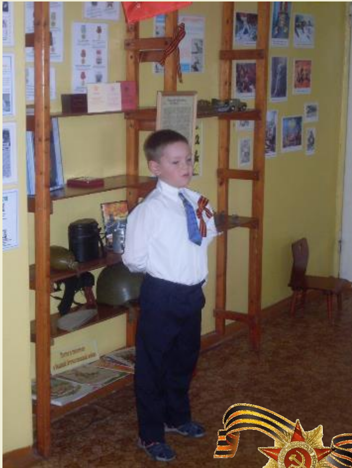
Участие родителей в оформлении мини-музея посвященного годам ВОВ