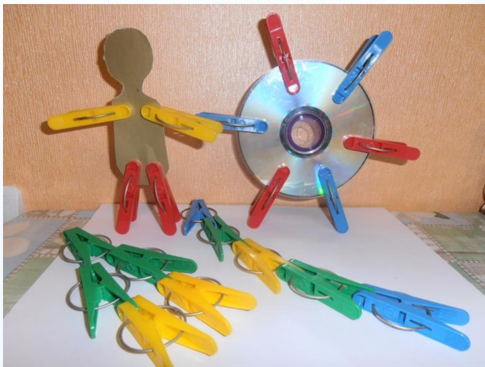
Игры с прищепками.