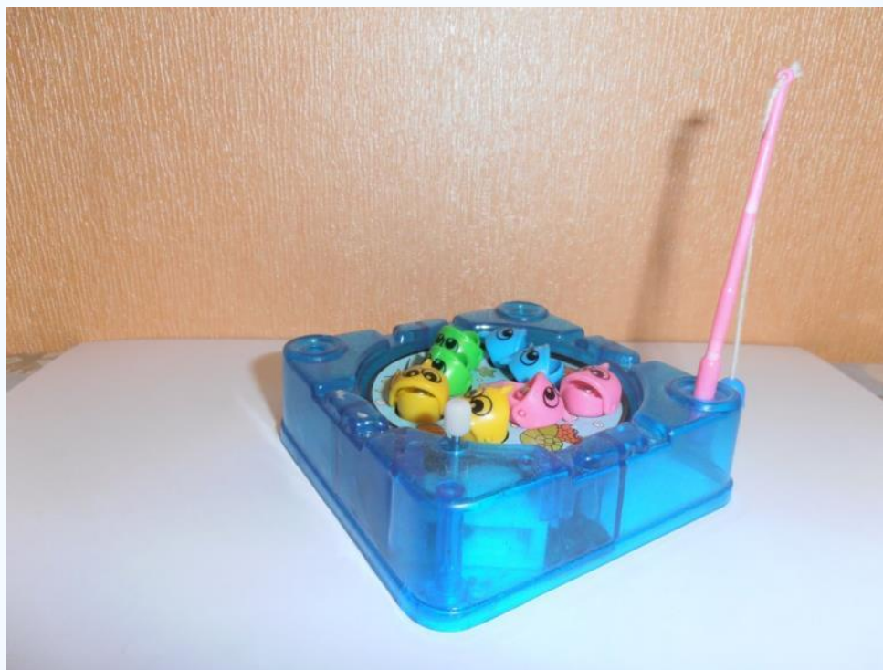
Игра «Поймай рыбку».