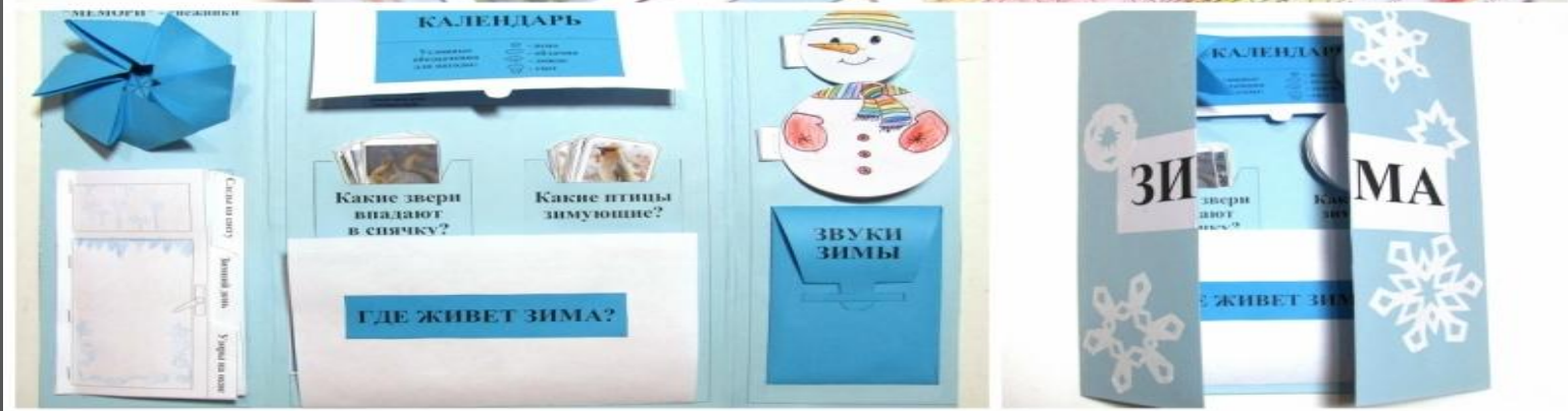
Тематическая папка «Зима»