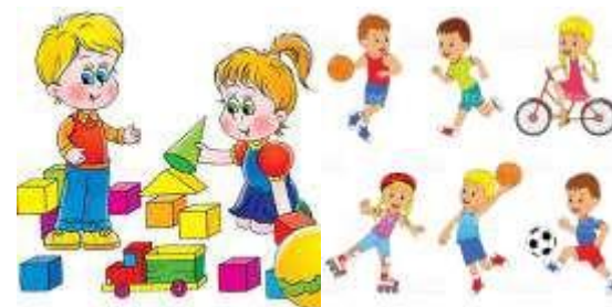
самостоятельная деятельность детей (игровая и двигательная)