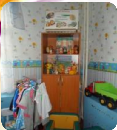
« Театр и музыка »