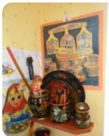
« Хохлома »