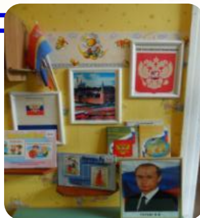
Патриотическо е воспитание