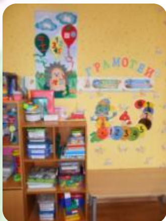
« Математика и конструирование »