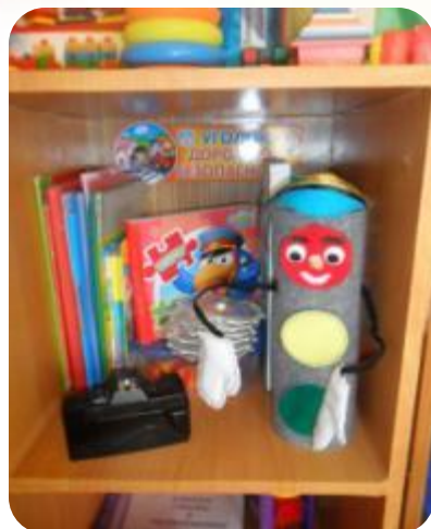
« Уголок безопасности »