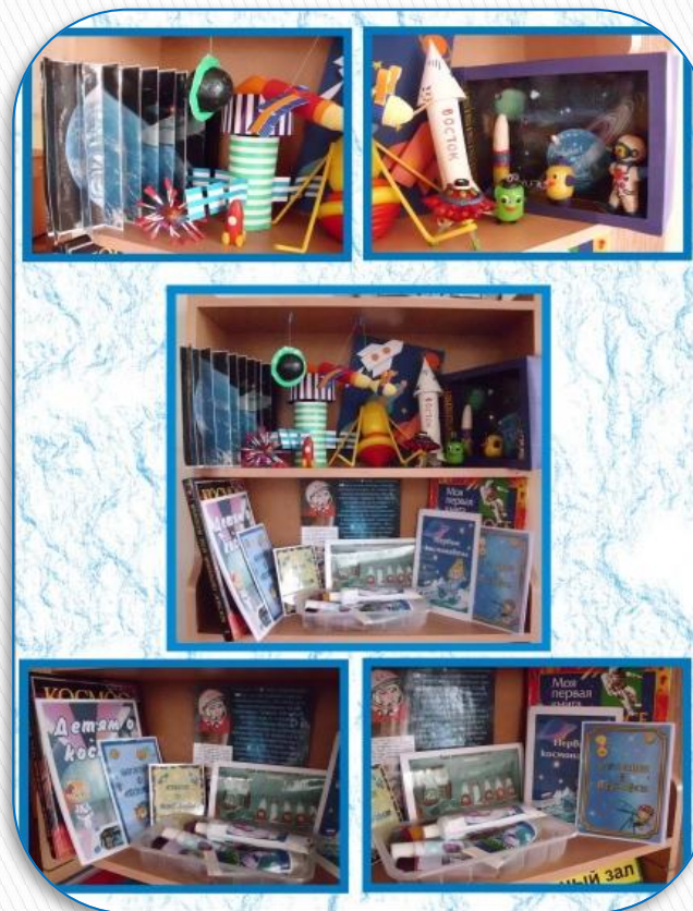
Книги о космосе