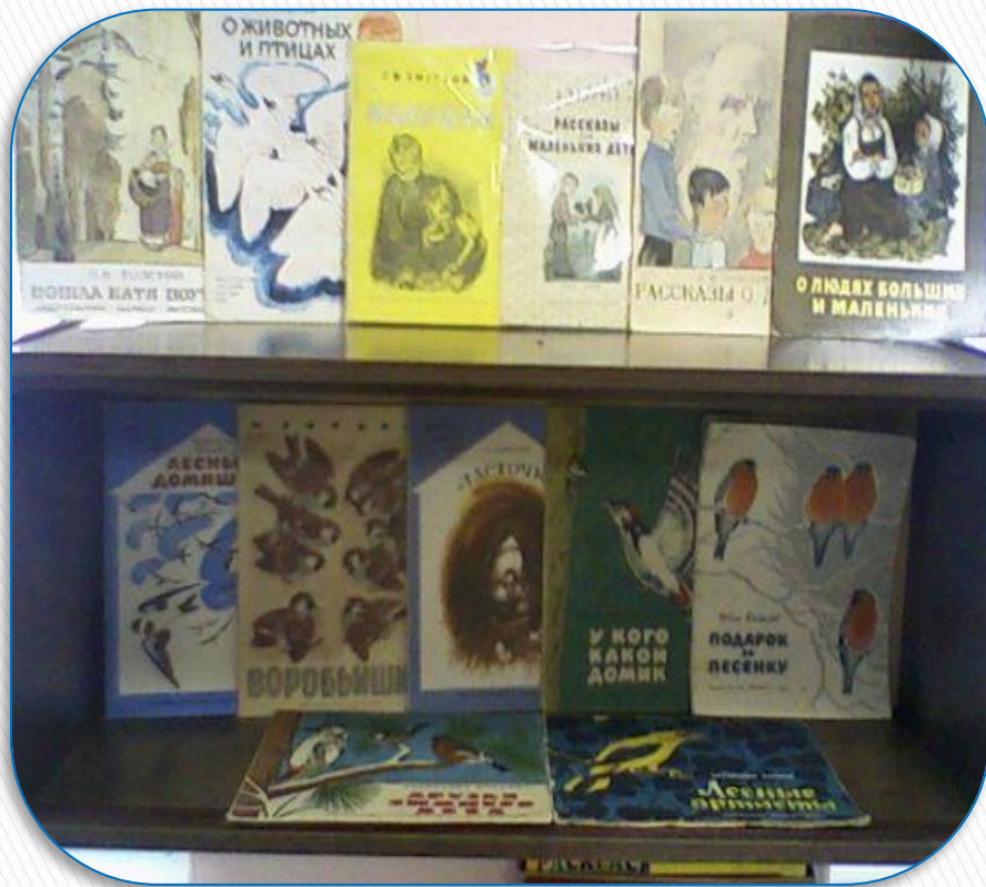
Книги о животных