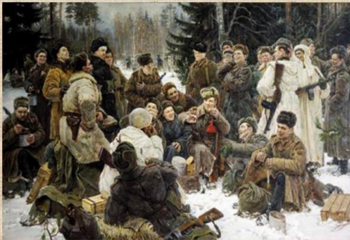
«Отдых после боя». Ю. Непринцев