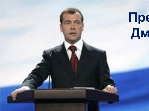
Президент России – Дмитрий Медведев