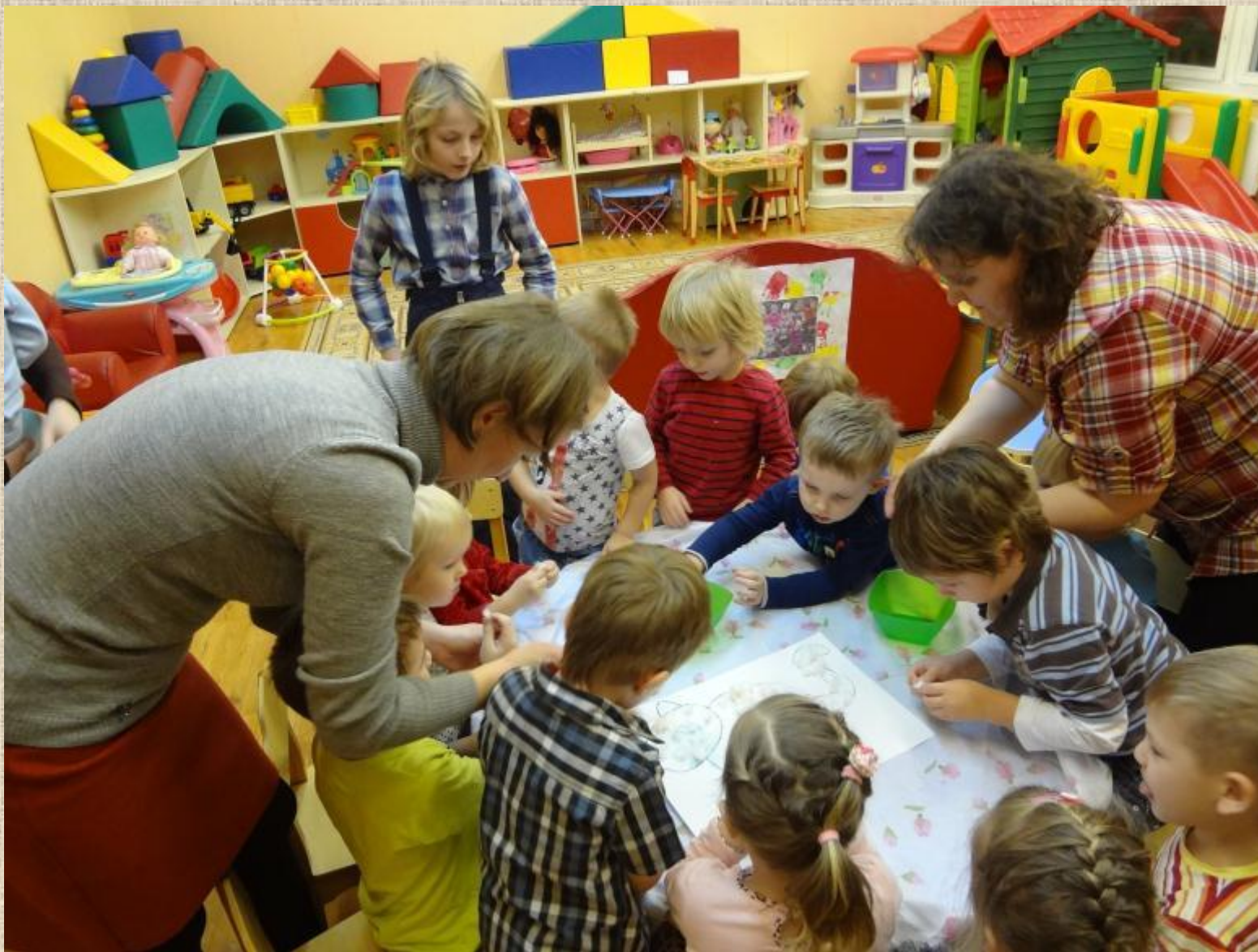
Изготовление коллажа «Кошка-зима»