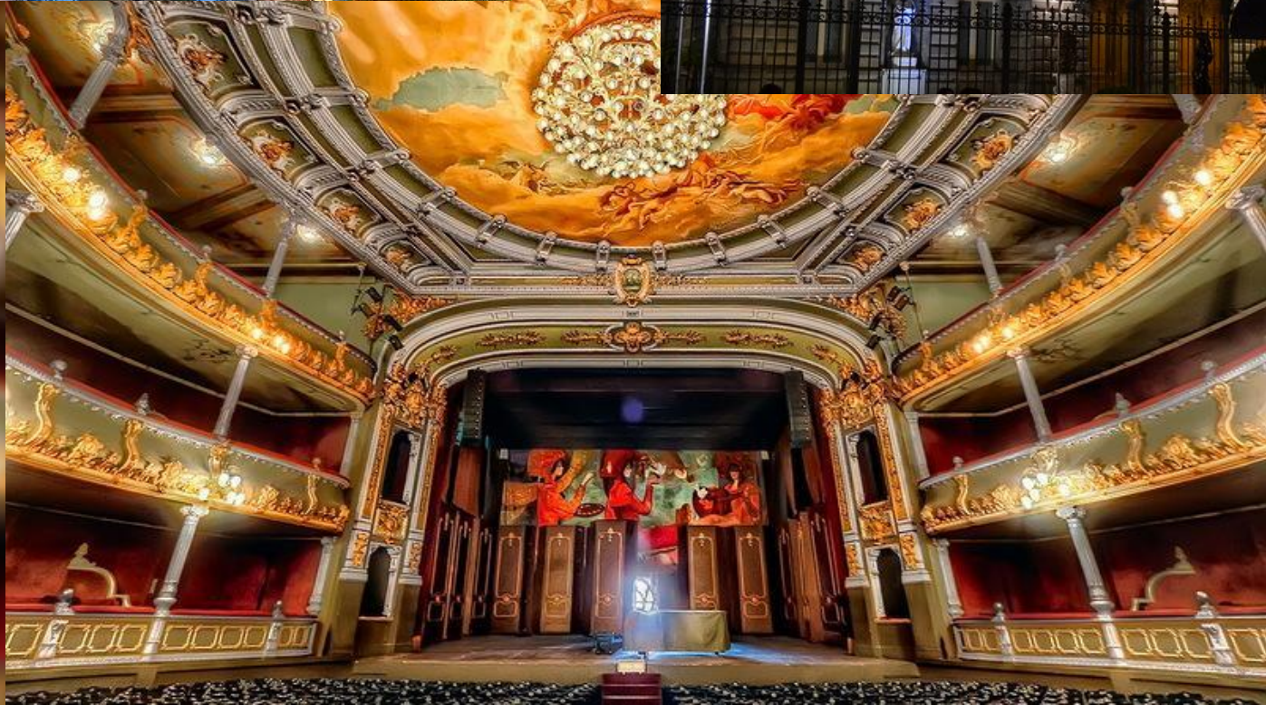
National Theatre of Costa Rica