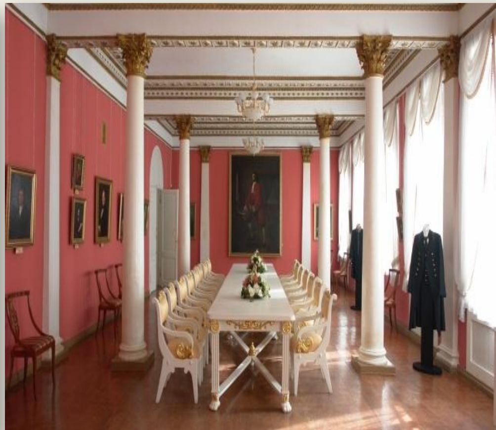
Дворянское собрание Музей-заповедник