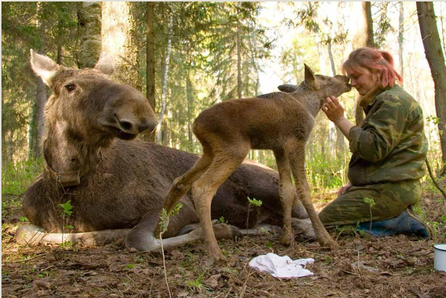
Сумароковская лосиная ферма Расположена в Костромской области. Единственная в европейской части России