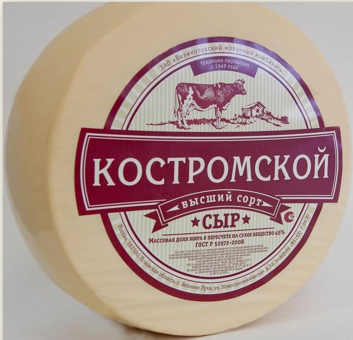
Знаменитый Костромской сыр