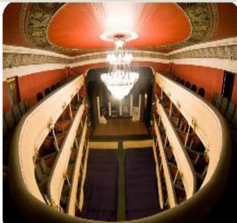
Костромской государственный драматический театр имени А.Н. Островского Создан в 1808 году