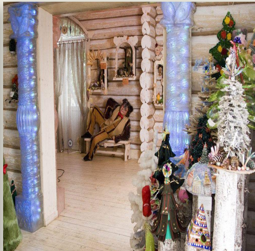
Терем Снегурочки Кострома – родина Снегурочки