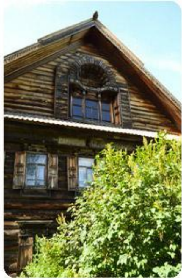
Музей-заповедник «Костромская слобода»