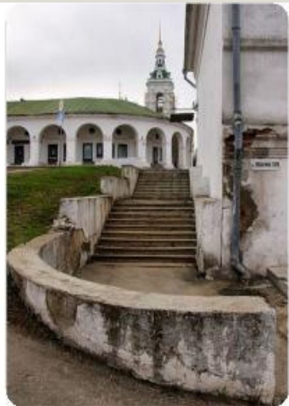
Торговые ряды Центральная часть Костромы