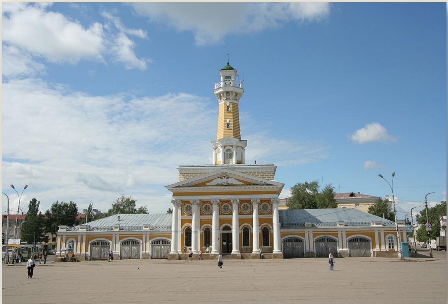
Пожарная каланча Центр Костромы