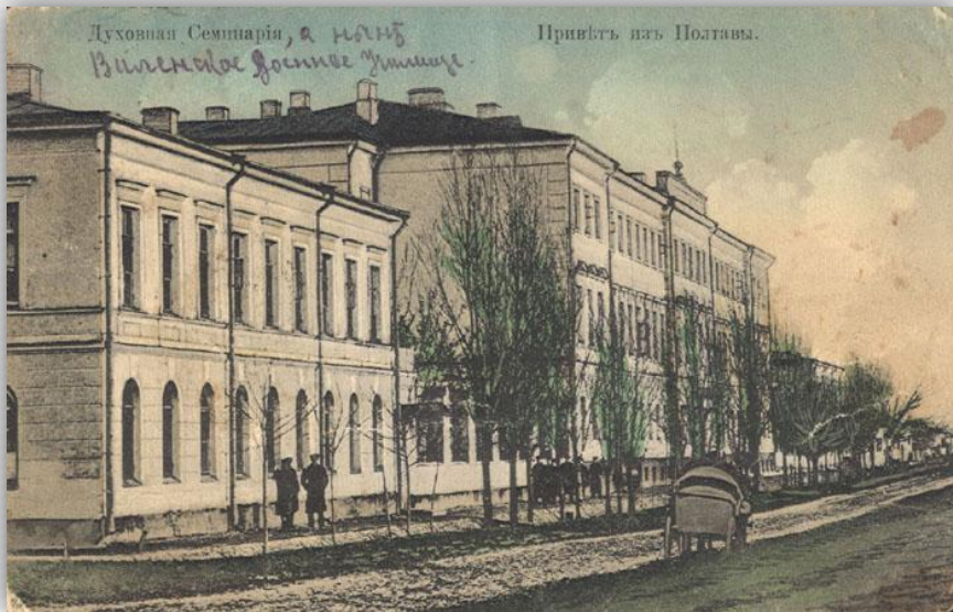
Полтавський духовний семінарій ПОЛТАВСЬКИЙ ДУХОВНИЙ СЕМІНАРІЙ