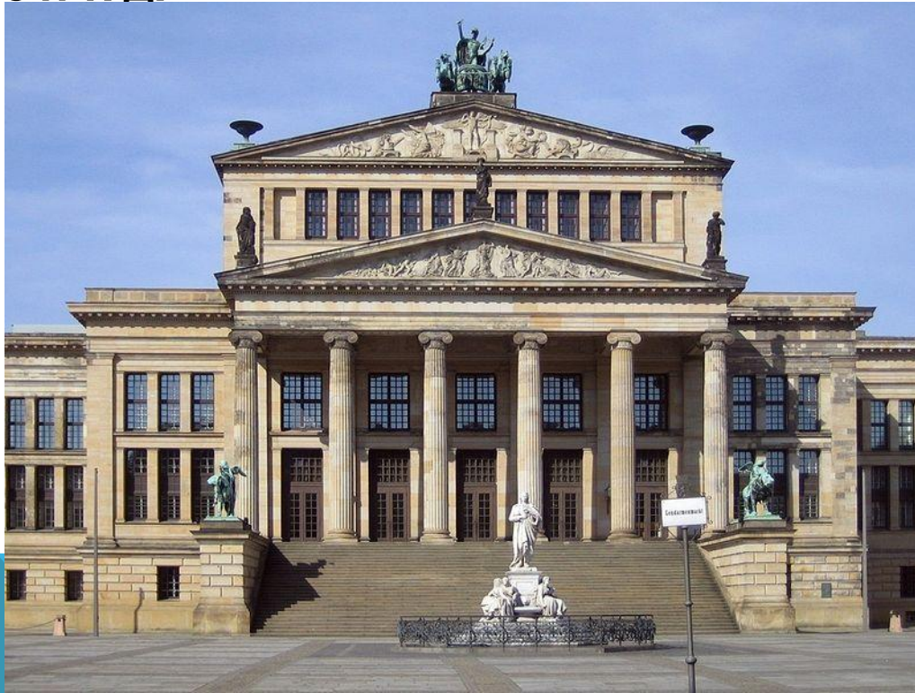
Берлинский драматический театр

Среди театров: Немецкая опера, Берлинская государственная опера, Комише опер, Театр им. Шиллера, Берлинер ансамбль, Немецкий театр, Театр на Курфюрстендамм, Берлинский драматический театр, Фридрихштадтпаласт, Народный театр, театр Метрополь, множество варьете и кабаре и т. д.