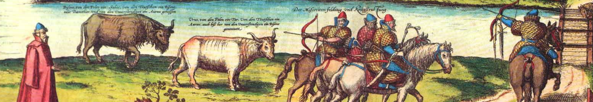
Der Moscoviten Feldzug und Kriegszug