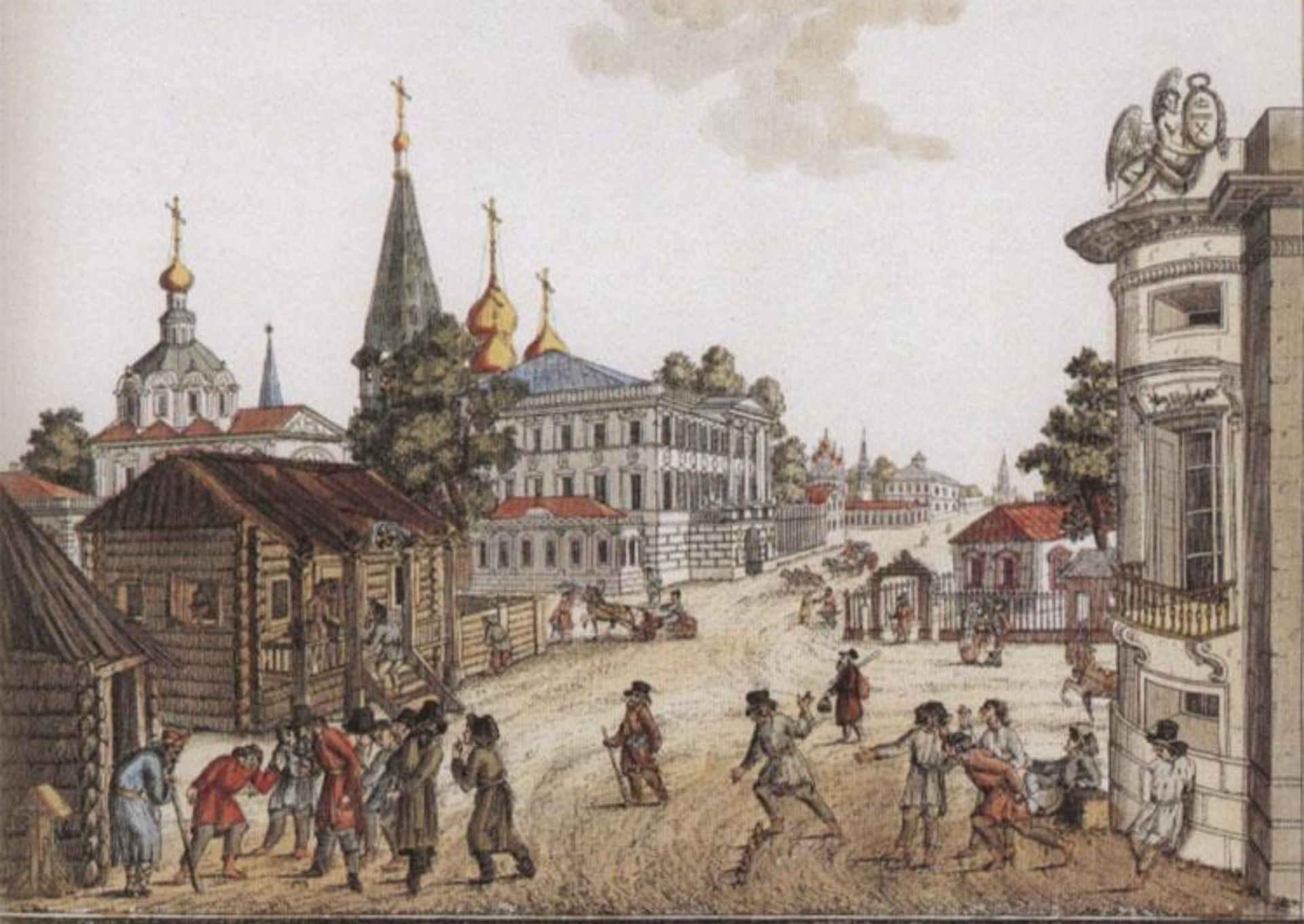
Московская улица в конце XVIII века