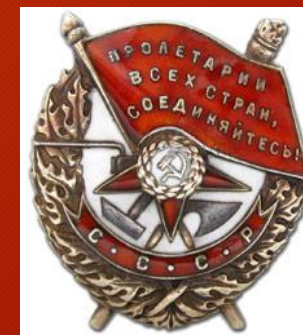
Орден Красного знамени