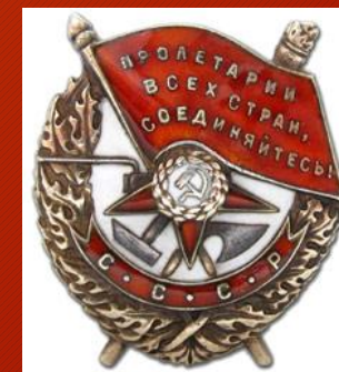
Орден Красного знамени