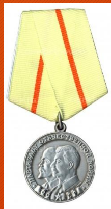
Медаль «Партизану Отечественной войны»