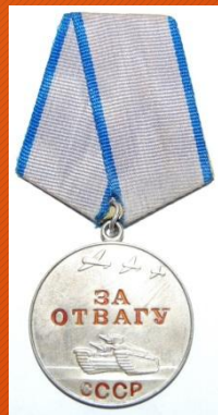
Медаль «За отвагу»