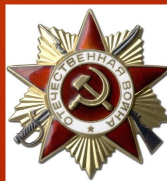
Орден Отечественной войны