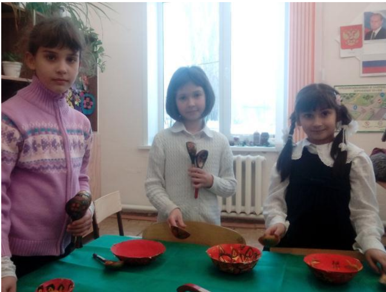
Классный час «История ложки»