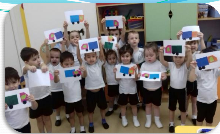
Аппликация: «Грузовик для папы»