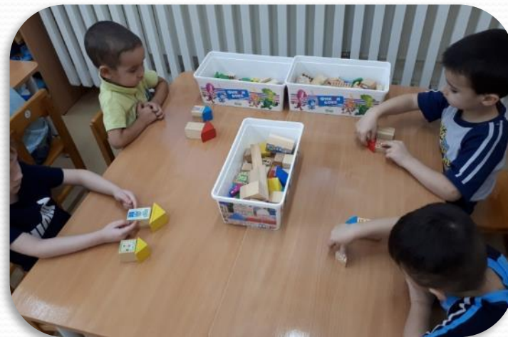
Конструирование: «Построим дом»