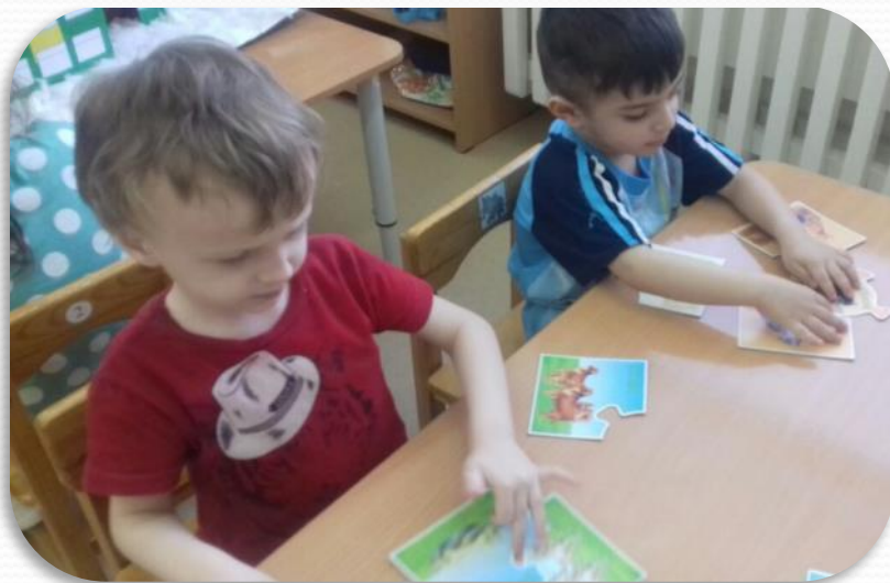
«Мамы и детки»