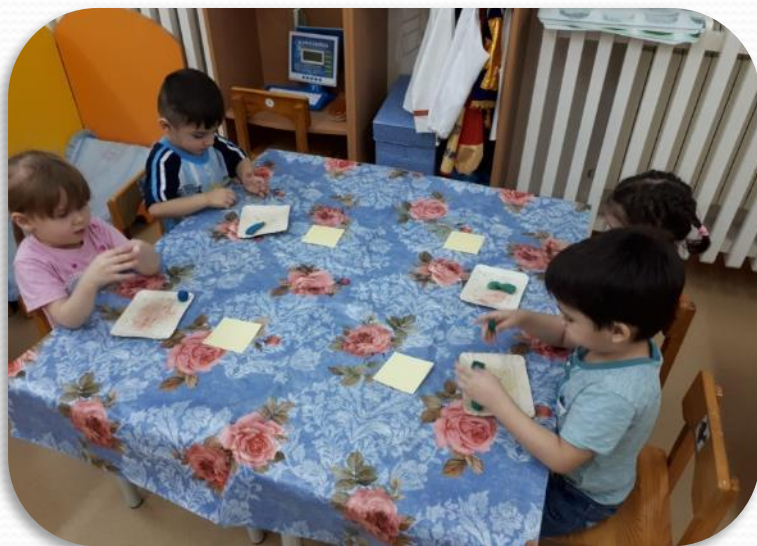
Лепка: «Мячик для брата (сестры)»