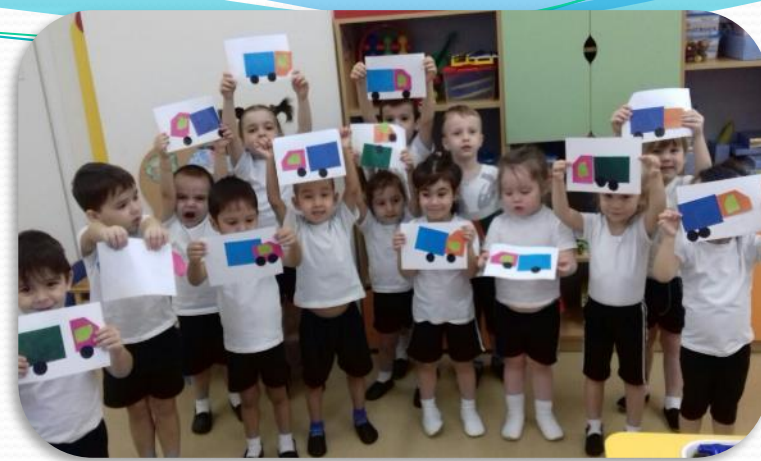
Аппликация: «Грузовик для папы»