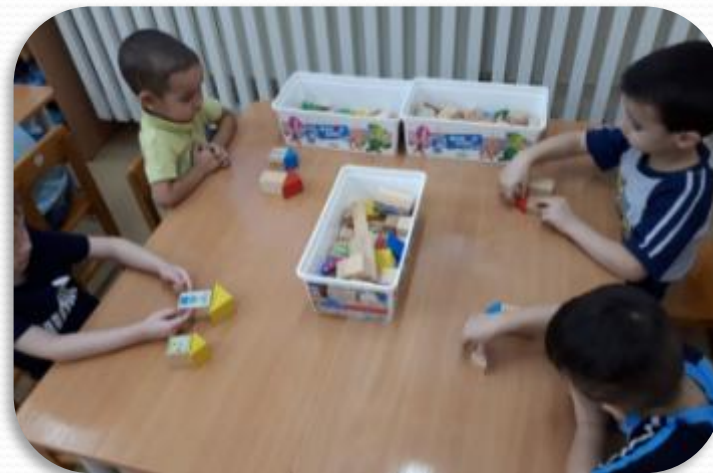
Конструирование: «Построим дом»