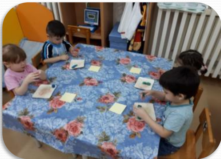
Лепка: «Мячик для брата (сестры)»