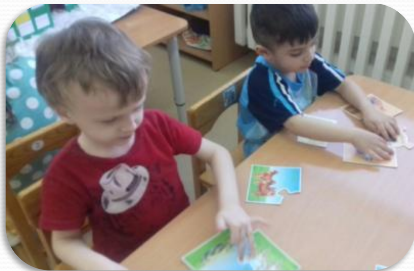
«Мамы и детки»