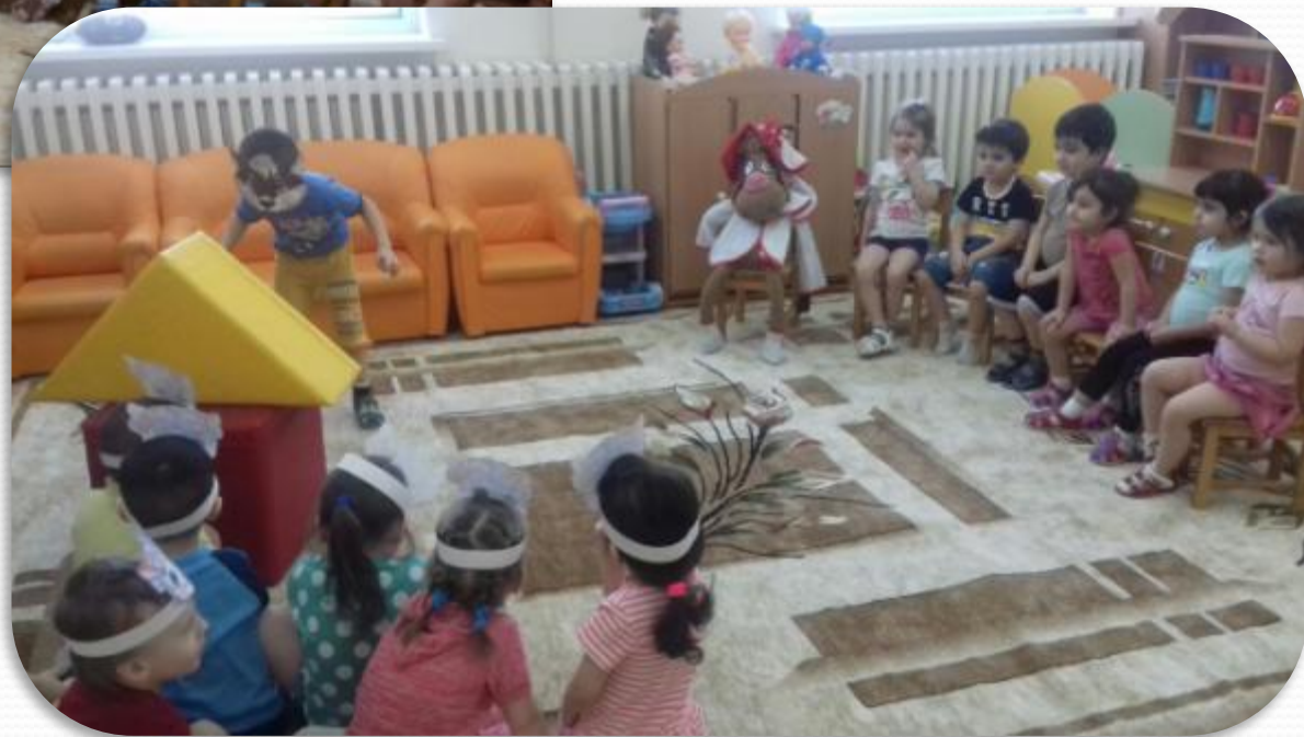
Театрализация сказки «Волк и семеро козлят»