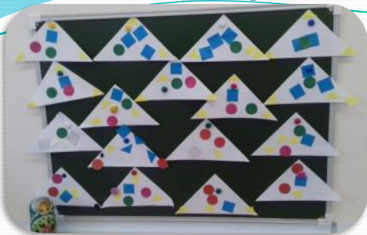
Аппликация: «Украсим платок для мамы»