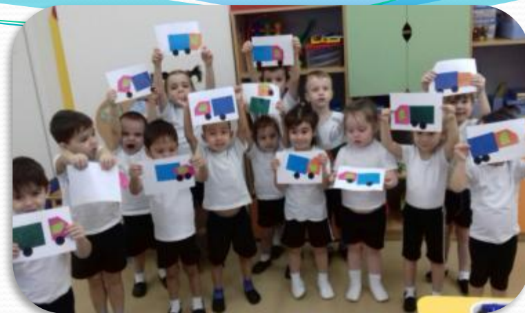
Аппликация: «Грузовик для папы»