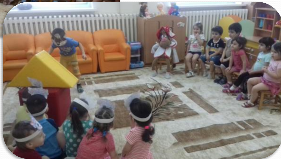
Театрализация сказки «Волк и семеро козлят»