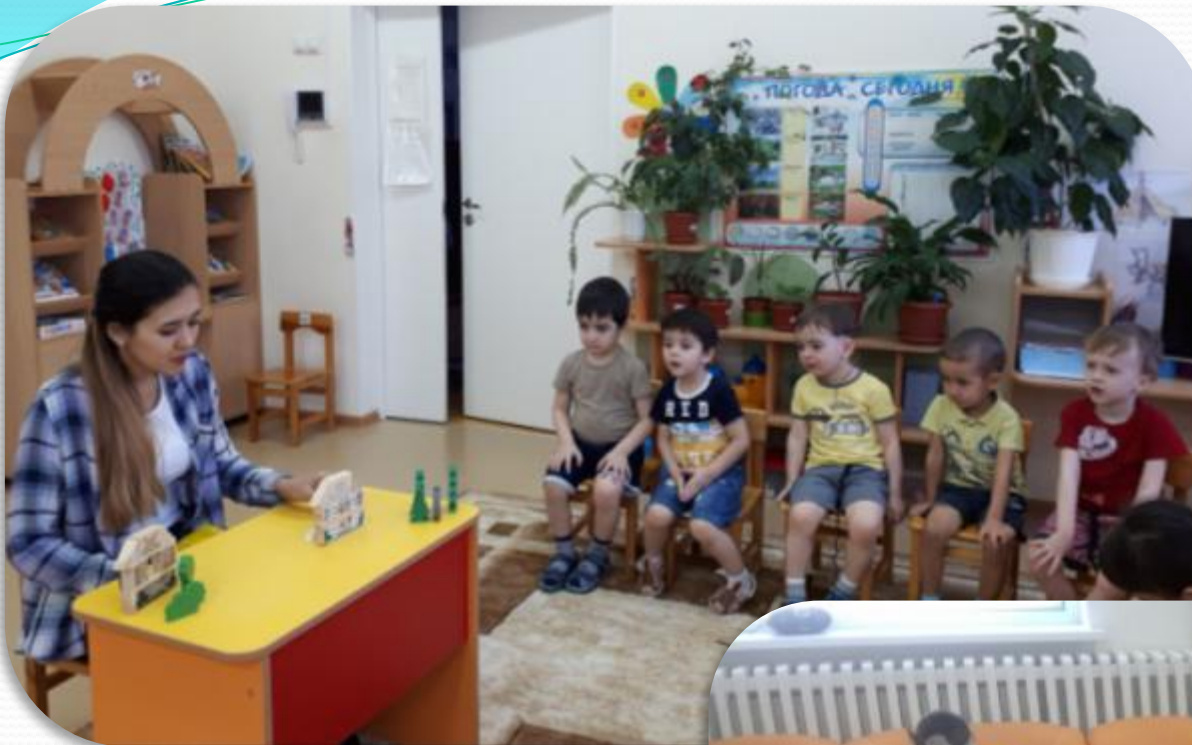
Показ настольного театра «Волк и семеро козлят»