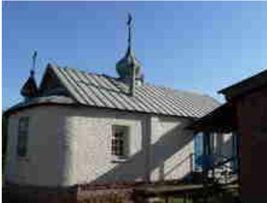
Петрово- Павловский храм С.Сероглазовка