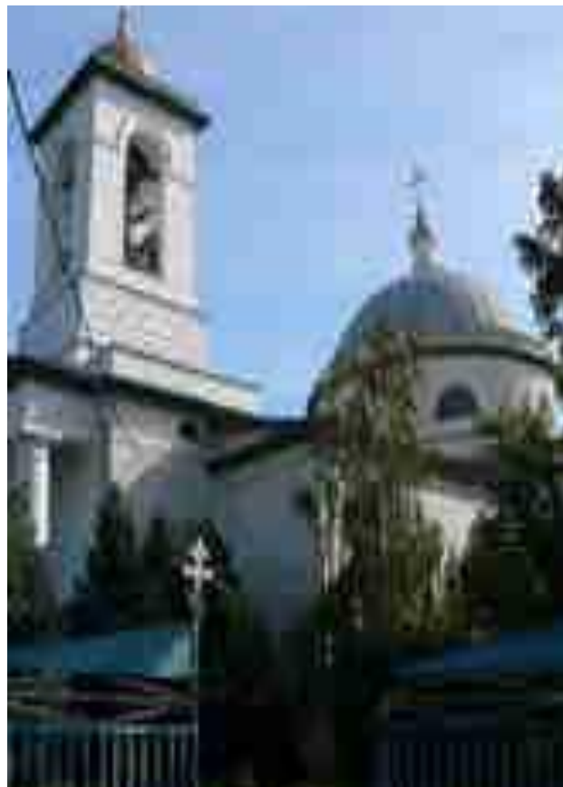
Свято-Троицкий собор С.Енотаевка