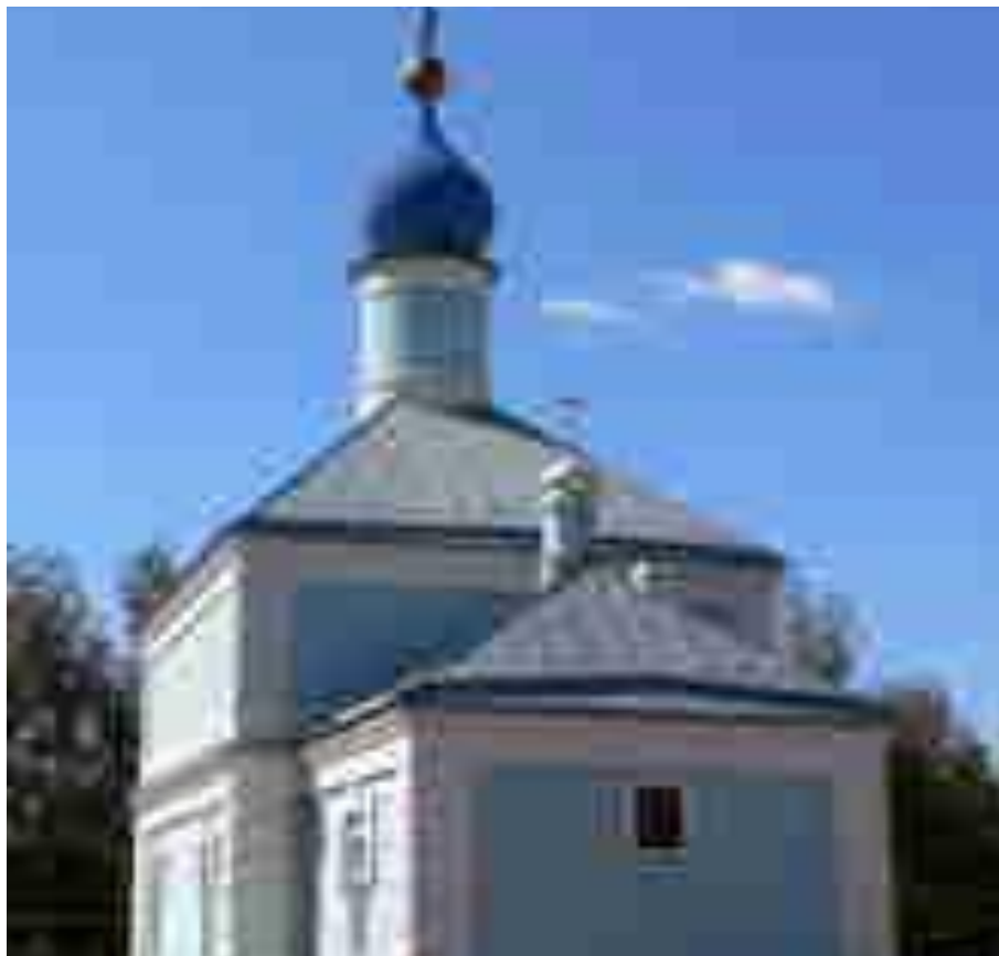
Храм Донской иконы Божией Матери с.Грачи