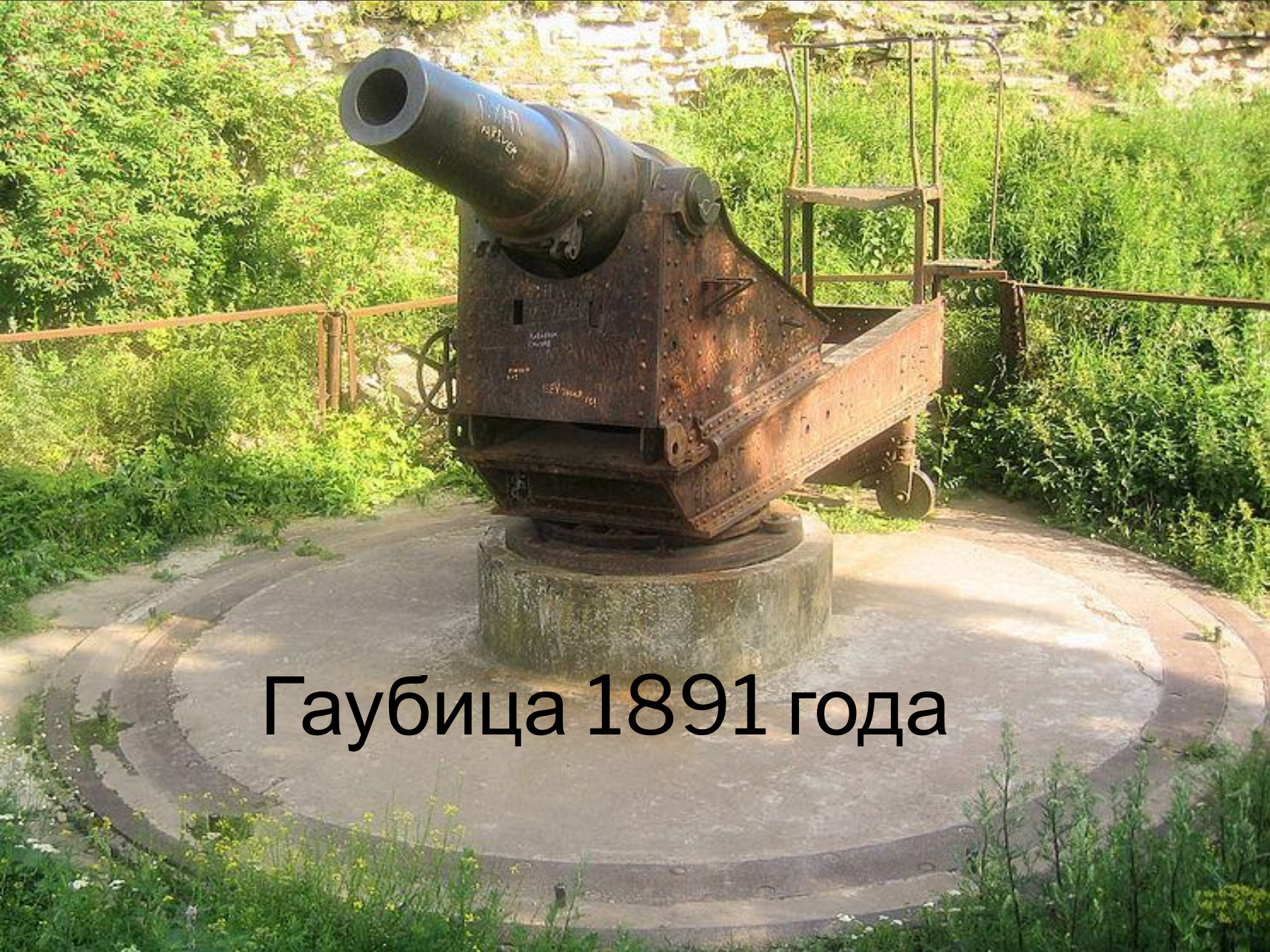
Гаубица 1891 года