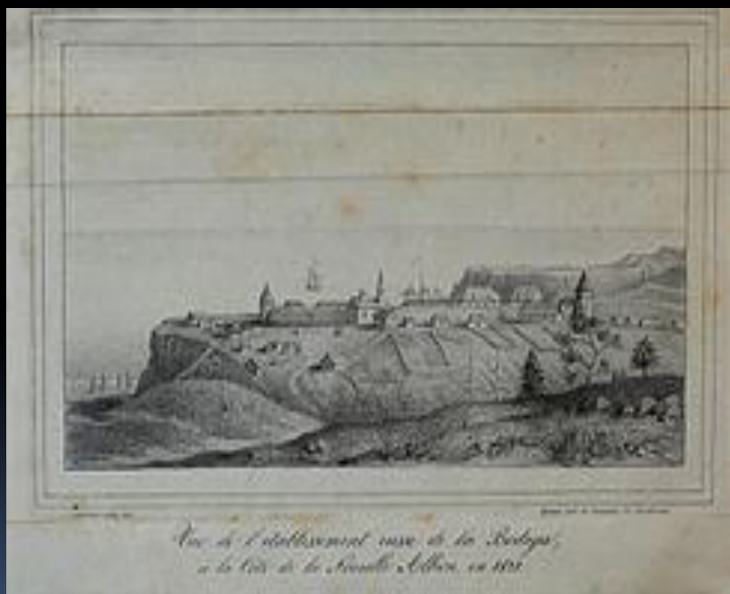
Крепость в 1828 году

Крепость Росс (англ. Fort Ross) — бывшее русское поселение на побережье Северной Калифорнии (США), в 80 км к северу от Сан-Франциско, основанное Российско-Американской компанией для промысла и торговли пушниной в 1812 году.