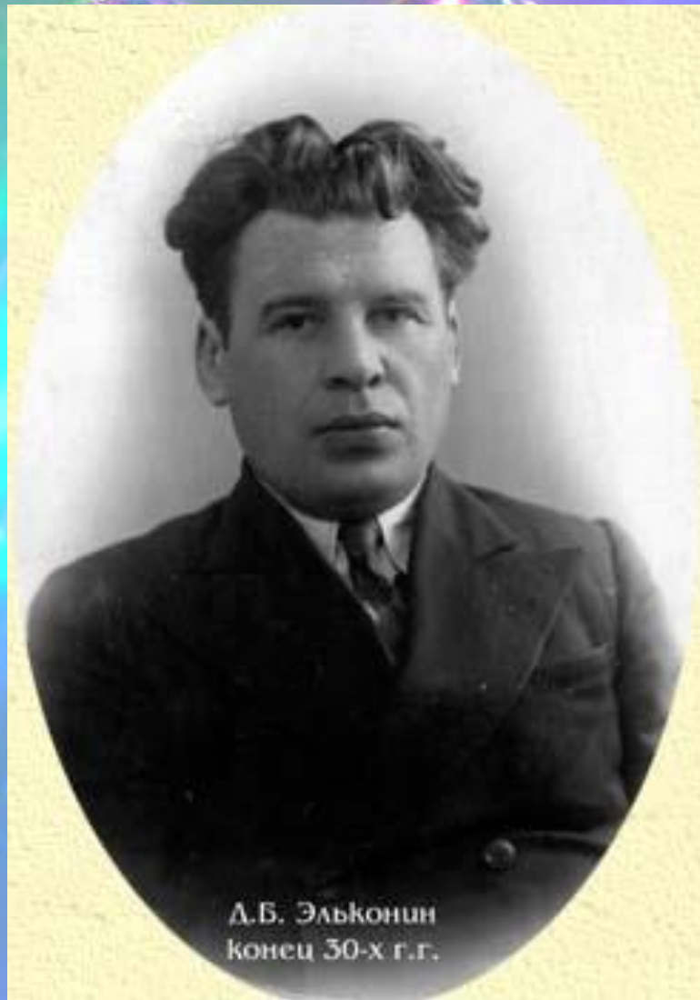
Д.Б. Эльконин конец 30-х г.г.

Даниил Борисович Эльконин считал, что кризис трех лет - это кризис социальных отношений, а всякий кризис отношений есть кризис выделения своего «Я».